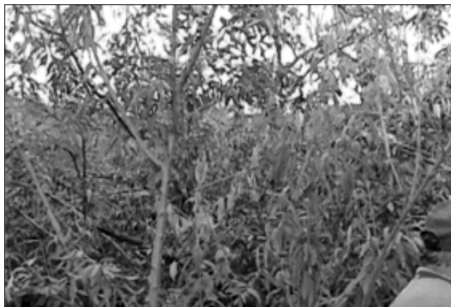
Figura 2. Síntomas visuales de la “secazón” del durazno. Sector El Peñón de Gabante.