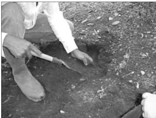
Figura 3. Productor del sector Las Margaritas, realizando un muestreo de suelo superficial.

Se tomaron muestras superficiales de suelo (0 - 20 centímetros) en tres de los sitios seleccionados: el Peñón de Gabante, La Ciénaga y Las Margaritas (Figura 3) y muestras subsuperficiales a diferentes profundidades: 20 - 40, 40 - 60 y 60 - 100 centímetros (Figura 4). En los otros tres sitios, sólo se muestreó el suelo superficial para análisis con fines de fertilización.