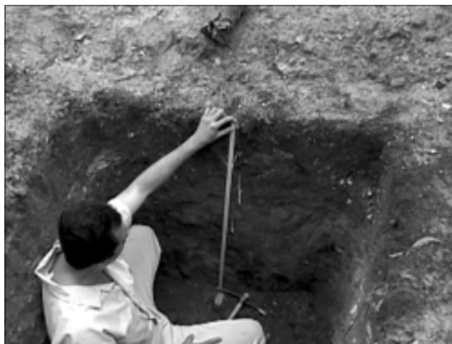
Figura 4. Técnico del INIA separando horizontes en calicata, el horizonte “A” de 15 cm de espesor, de color oscuro, alta acumulación de materia orgánica. Sector Las Margaritas.

Se recabó información complementaria sobre la problemática del duraznero, manejo de plantaciones, tipo de fertilizantes orgánicos e inorgánicos utilizados, dosis, frecuencia y producción estimada. También, se aplicó el método del diagnóstico participativo para la recolección de los datos (Bolívar et al. , 1999), en dos sectores del Municipio Tovar y entrevistas individuales a productores de cada sector muestreado.