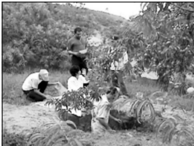
Figura 7. Actividades sobre muestreo de suelos y plantas, realizadas por investigadores, extensionistas y productores. Sector Las Margaritas y Gabante.

La recomendación establecida para esas condiciones de suelo es la de aplicar 2.500 kilogramos/hectárea de carbonato de calcio. Se sabe que la cal agrícola contiene 80% de carbonato de calcio se procede a aplicar una regla de tres simple para calcular la dosis de cal por hectárea. En otras palabras, si cada 100 kilogramos de cal agrícola contienen 80 kilogramos de carbonato de calcio, cuánta cal agrícola (X) se necesitará, si la recomendación es de 2.500 kilogramos/hectárea de carbonato de calcio: