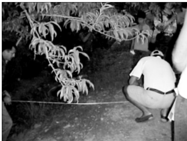
Figura 5. Productor y técnico midiendo el radio de copa (r), distancia entre el tronco de la planta y proyección de la copa del árbol Sector Gabante Abajo. Día de campo, octubre del 2000.

Con el propósito de complementar las recomendaciones que se suministran, se presentan varios ejemplos acerca de los cálculos que se deben realizar para determinar la dosis de cal agrícola que es necesario aplicar a cada planta. Esos ejemplos se basan en diferentes características de suelos para que sirvan de guía al lector: