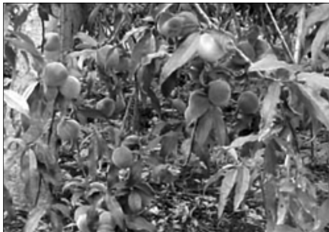
Figura 1. Planta de durazno mostrando su vigor. El Jarillaso, sector Las Margaritas.

y/o causando el problema de la “secazón” del durazno, en el municipio Tovar del estado Aragua (Figura 2).