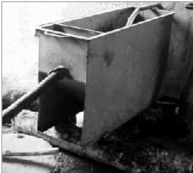
Figura 2. Vista general del prelimpiador de jugos de caña.