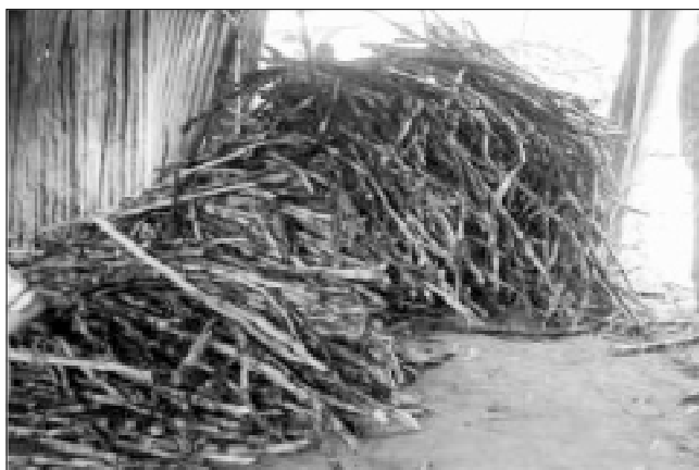
Figura 1. Caña de la variedad PR 61632.