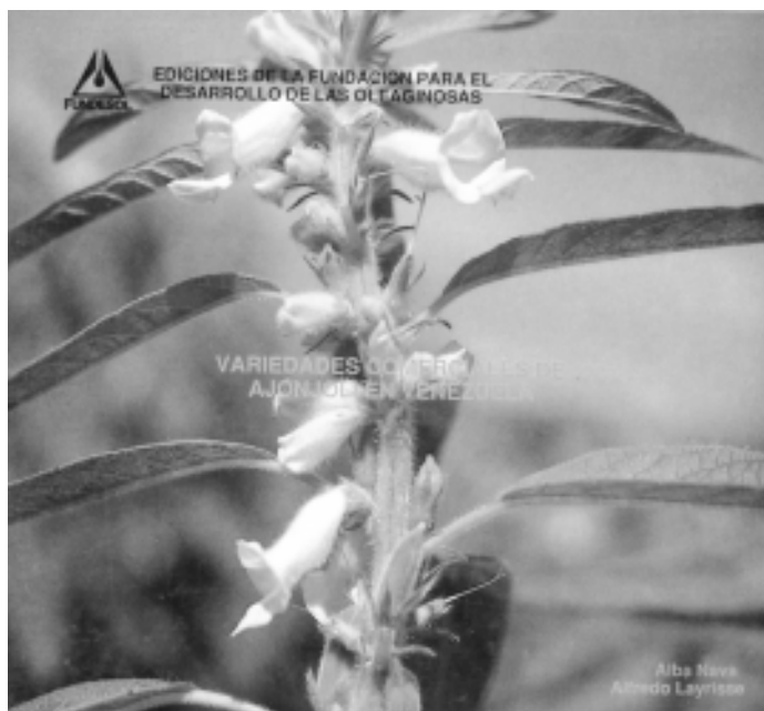
Variedades comerciales de ajonjolí en Venezuela Autor: Alba Navas Alfredo Layrisse

Partiendo de estas experiencias se puede afirmar, que como sistema de producción, el desarrollo endógeno no es una utopía sino una realidad. Ahora lo importante es sistematizar el proceso, sobre todo en sus componentes de coordinación interinstitucional, hacerle seguimiento y evaluar los resultados.