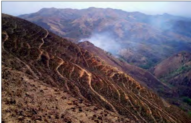
Figura 6. Daños ocasionados sobre la superficie del suelo producto de la presencia de ganado y las quemas.

un avanzado grado de erosión hídrica causante en gran parte del aporte de sedimentos a los cuerpos de agua. (Figura 6, 7, 8, 9 y 10).