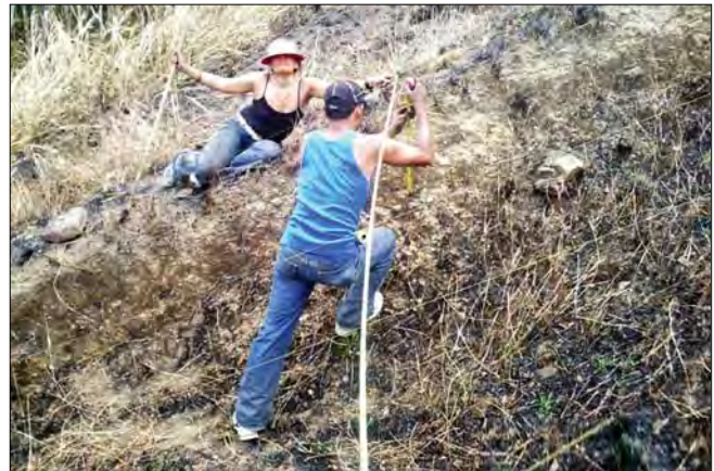
Figura 9. Cárcava en la cuenca alta del río Orituco en el sector El Tiamo.