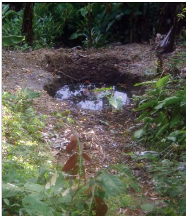
Figura 2. Nacimiento de la quebrada del Zanjón de Caramacate.