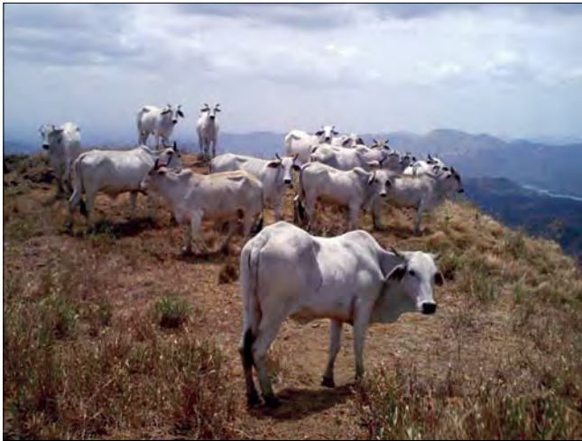
Figura 3. Ganadería de carne en la cuenca alta del Río Orituco.

Entre las principales actividades agropecuarias establecidas en la zona, se puede contemplar la ganadería de carne (Figura 3) y la agricultura (caraota, café, apio, ajíes, parchita, tomate entre otras).