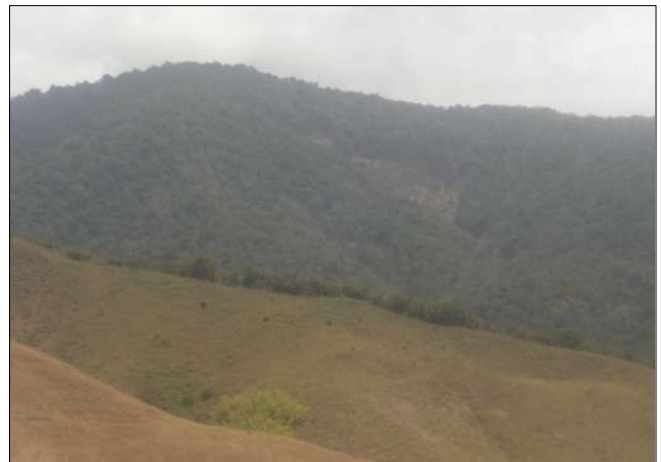
Figura 5. Área forestal reducida notablemente. Parque Nacional Guatopo.

Los suelos al quedar sin cobertura vegetal y al estar bajo los efectos constantes de las quemas, van perdiendo su estructura y quedan sometidos al intemperismo (erosión eólica, hidráulica y mecánica), esto genera la formación cárcavas, que indican