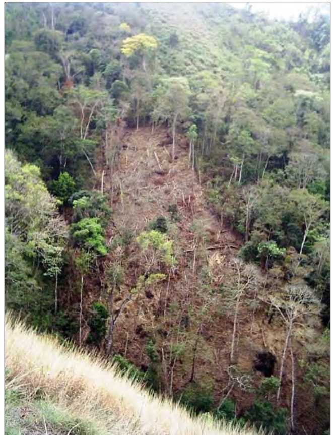
Figura 4. Elaboración de conucos en la cuenca alta del río Orituco.

El desarrollo y proliferación de estas malas prácticas agrícolas durante los últimos 20 años ha ido mermando la calidad del agua, el suelo y los bosques presentes en su geografía, en muchas áreas de la cuenca se ha producido el reemplazo de la vegetación original constituida por un bosque semi deciduo por un sistema de sabana con parches sin vegetación apreciable (Figura 5).