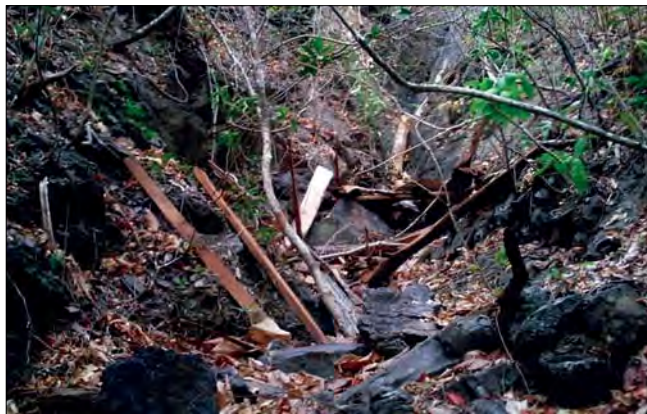
Figura 7. Tala en la cuenca alta del río Orituco.