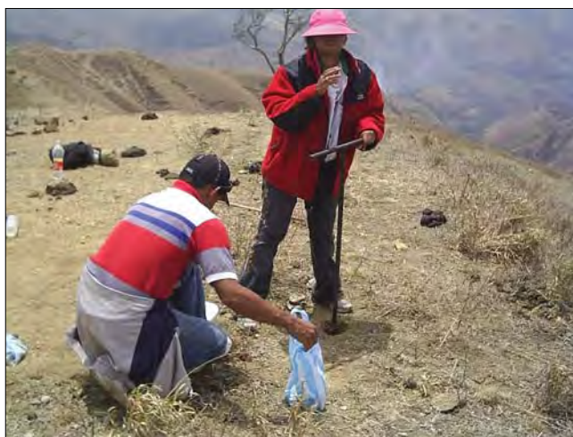
Figura 1. Cuenca alta del Río Orituco específicamente en el sector El Cielito, microcuenca de Santa Elena.