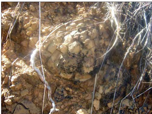
Figura 8. Intemperismo en la cuenca alta del río Orituco.