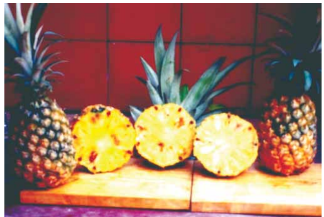
Figura 5. Frutos atacados por el gusano de la piña, se aprecian las pudriciones en la pulpa.