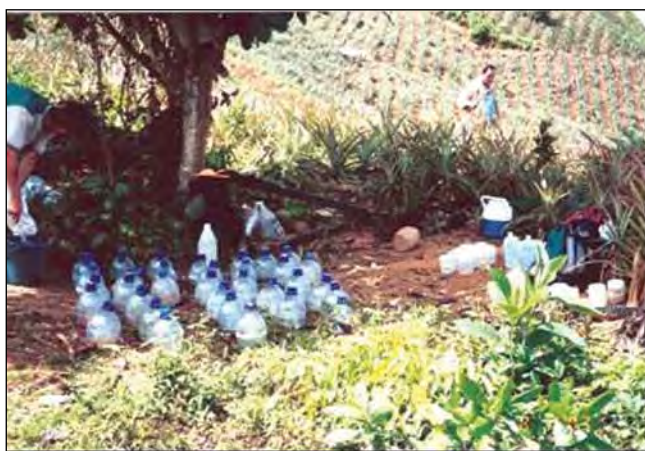
Figura 7. Uso de trampas con atrayentes en plantación comercial de piña de Montañas de Peraza, estado Trujillo.