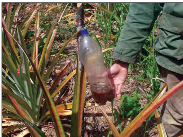
Figura 8. Trampa artesanal fabricada con material de desecho.