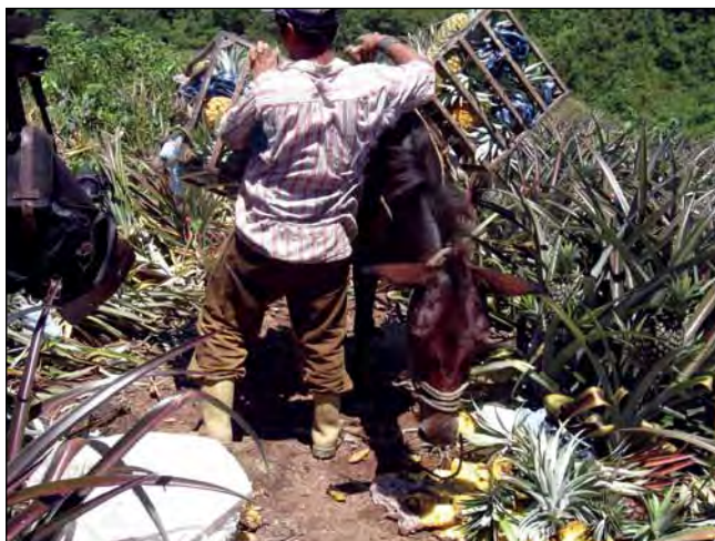
Figura 6. Frutos atacados por el gusano de la piña, suministrados a los animales.