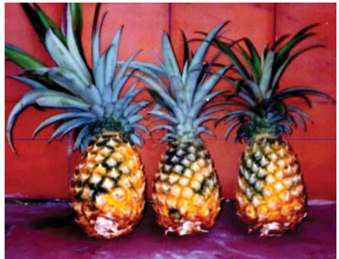
Figura 4. Frutos atacados por el gusano de la piña, obsérvese la desuniformidad en la maduración de la cáscara.

El daño es causado por las larvas de este insecto, las cuales se localizan principalmente entre la cáscara y la pulpa del fruto, en algunos casos se han encontrado en áreas cercanas al corazón (prolongación del pedúnculo o eje de la inflorescencia). Los frutos afectados presentan en la cáscara coloraciones amarillo pálido, desuniformes y áreas verdes alternadas con áreas rojizas o anaranjadas (Figura 4); al abrirlos se observan las larvas formando galerías y alimentándose de la pulpa, lo cual trae como consecuencia la pudrición y pérdida del valor comercial de los mismos (Figura 5).