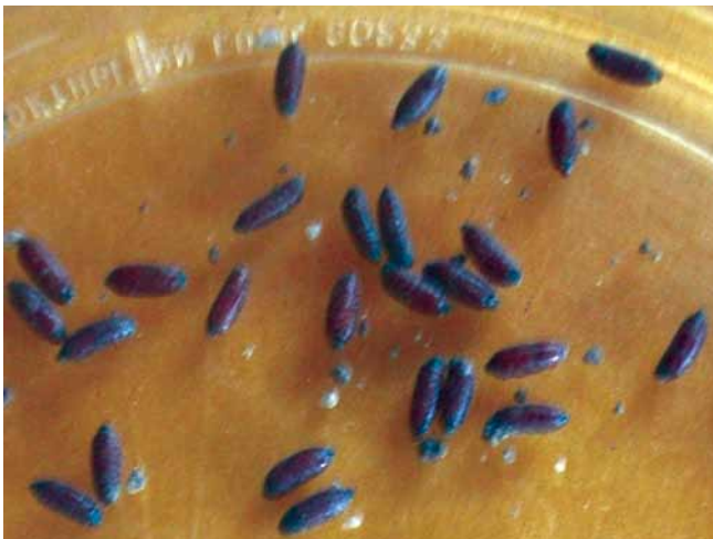
Figura 3. Pupas del gusano de la piña.

Pupa: es una cápsula de forma cilíndrica de color café rojizo, compuesta de 11 segmentos, que mide entre 5 milímetros de largo y 1,8 milímetros de diámetro. Presenta unos abultamientos muy notorios, ubicados en la parte trasera, los cuales se denominan espiráculos. El área de la cabeza es muy definida y se puede apreciar fácilmente (Figura 3). En el laboratorio se ha observado que el gusano o larva forma la pupa fuera del fruto, generalmente en el sustrato o suelo colocado para este fin. La pupa tarda entre 15 y 20 días para dar origen al nuevo adulto.