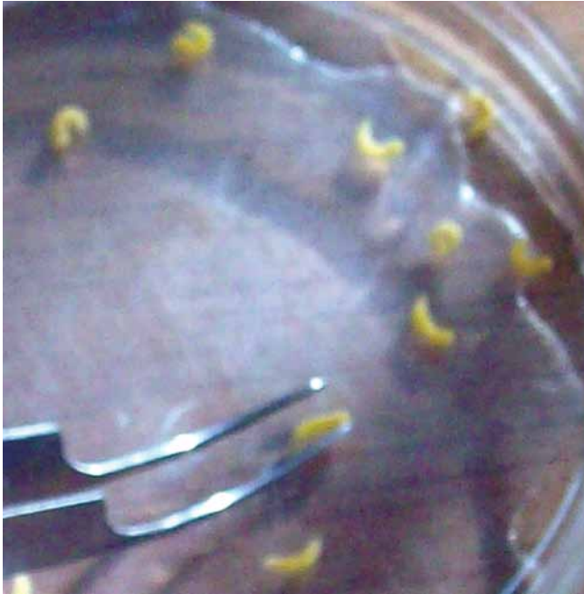
Figura 2. Larvas del gusano de la piña.

Pupa: es una cápsula de forma cilíndrica de color café rojizo, compuesta de 11 segmentos, que mide entre 5 milímetros de largo y 1,8 milímetros de diámetro. Presenta unos abultamientos muy notorios, ubicados en la parte trasera, los cuales se denominan espiráculos. El área de la cabeza es muy definida y se puede apreciar fácilmente (Figura 3). En el laboratorio se ha observado que el gusano o larva forma la pupa fuera del fruto, generalmente en el sustrato o suelo colocado para este fin. La pupa tarda entre 15 y 20 días para dar origen al nuevo adulto.