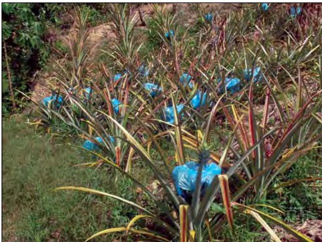
Figura 9. Frutos embolsados en plantación comercial de piña de Montañas de Peraza, estado Trujillo.

El gusano de la piña, está causando severos daños en los cultivos, pero el piñicultor puede manejar la situación si sigue las anteriores recomendaciones. Las mismas son una guía para manejar la plaga sin aplicar insecticidas tóxicos, y que esta no cause daño económico al cultivo. Para mayor información dirigirse a la sede de INIA en el estado Trujillo.