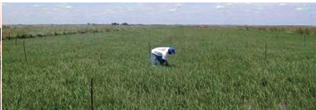
Foto 9. Malla entomológica (izquierda) y evaluación por metro cuadrado de arroz (derecha).