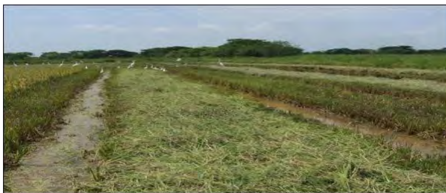
Foto 8. Residuos de cosecha de arroz.