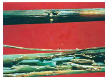
Foto 5. Daño de Taladrador (superior) y roedor (rata arrocera) (inferior)