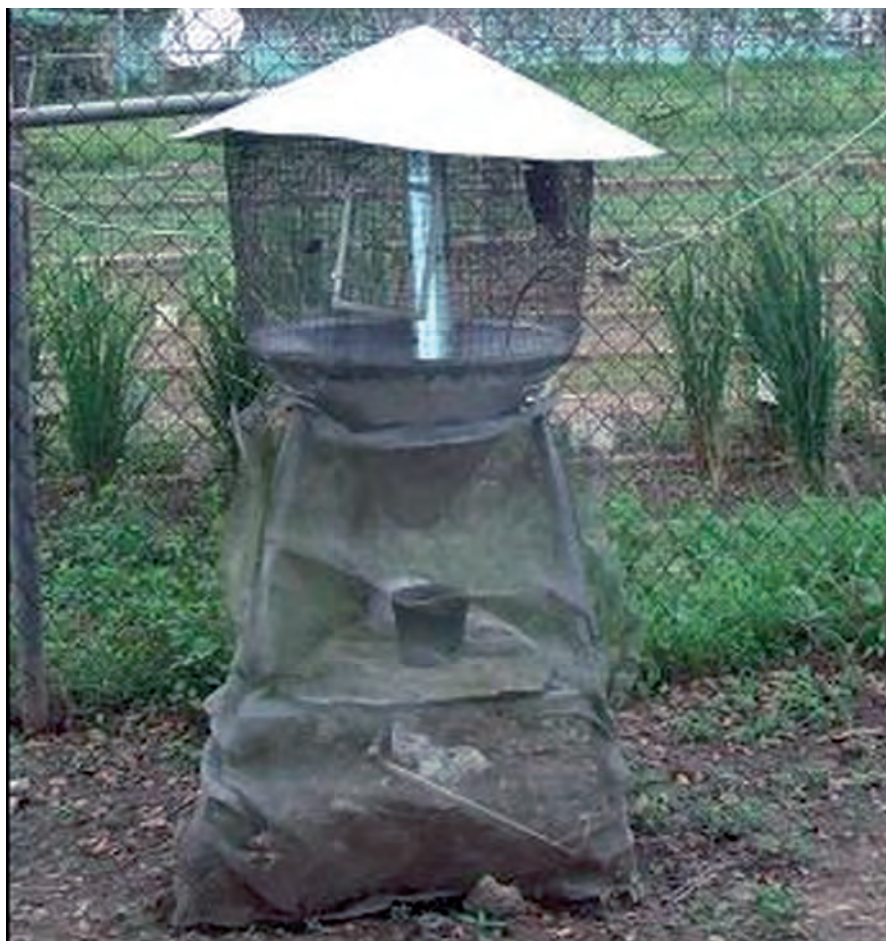
Foto 10. Trampa de luz del INIA Guárico, en Calabozo.