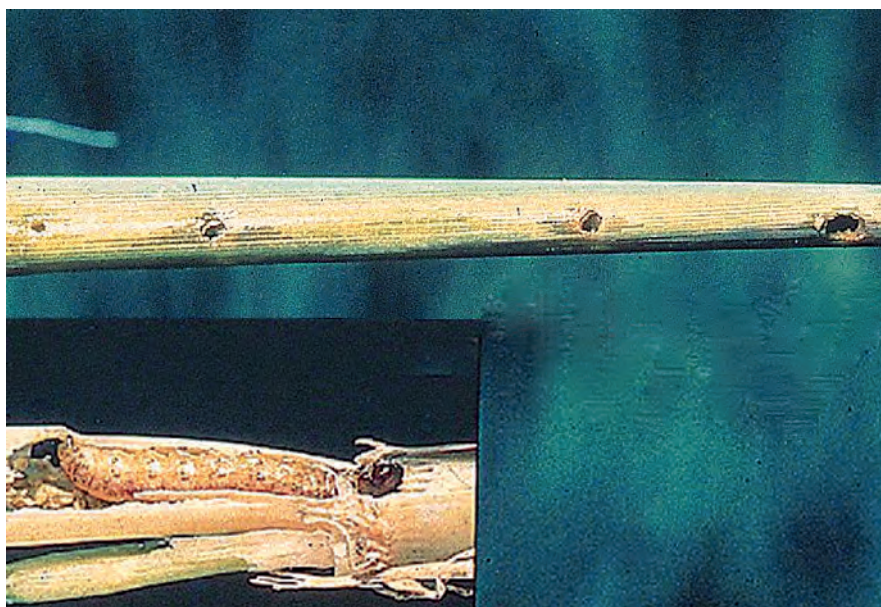
Foto 6. Daño de Diatraea spp. y detalle de la larva en el tallo.