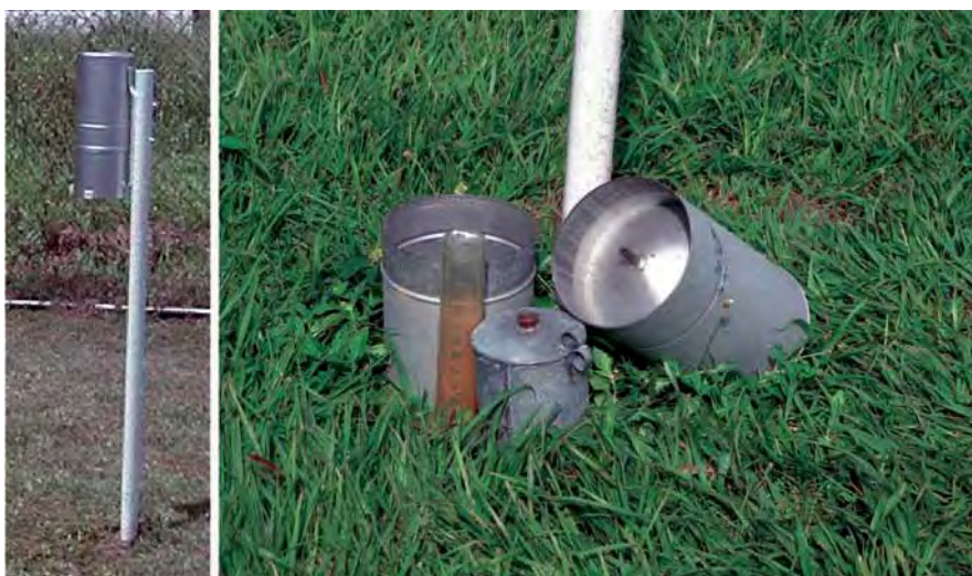
Foto. Detalles del pluviómetro de cántaro.

Cántaro, que es un instrumento de lectura directa, instalado sobre soporte fijo a 1,50 metros sobre el suelo, (Foto). Para realizar las estimaciones se utilizaron los valores totales mensuales de precipitación de 54 años, correspondientes al período señalado. Los datos que se utilizaron, fueron sometidos a un control de calidad, realizando un análisis exploratorio de datos (AED) para el cual se utilizó el programa estadístico JMP versión 6; para verificar su consistencia y posibles fallos.