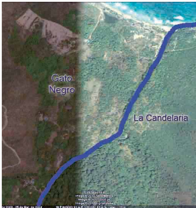
Foto 1. Imagen satelital, que muestra los sectores “Gato Negro”, lado oeste del río y “La Candelaria”, lado este.

nes). Por esta razón, se procedió a realizar un estudio de capacidad de uso de los suelos, en los sectores mencionados, pertenecientes al municipio Costa de Oro del estado Aragua. El área bajo estudio cuenta con una superficie de 138 hectáreas, de vegetación boscosa (bosque seco tropical), clima tropical muy seco, precipitación promedio anual 1.000 milímetros y suelos de bajo potencial agrícola con pH alcalinos.