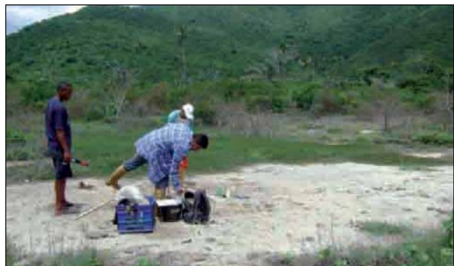
Foto 2. Superficie de terreno, donde años atrás había una vegetación boscosa que desapareció como consecuencia de malas prácticas agrícolas.

por el Sistema de Capacidad de uso fueron clases, subclases y unidades de capacidad.