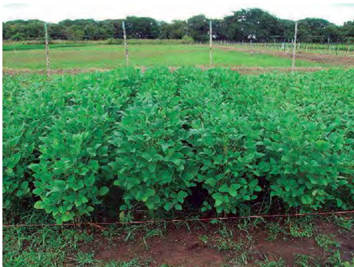
Foto 1. Cultivar BRS Aurora.