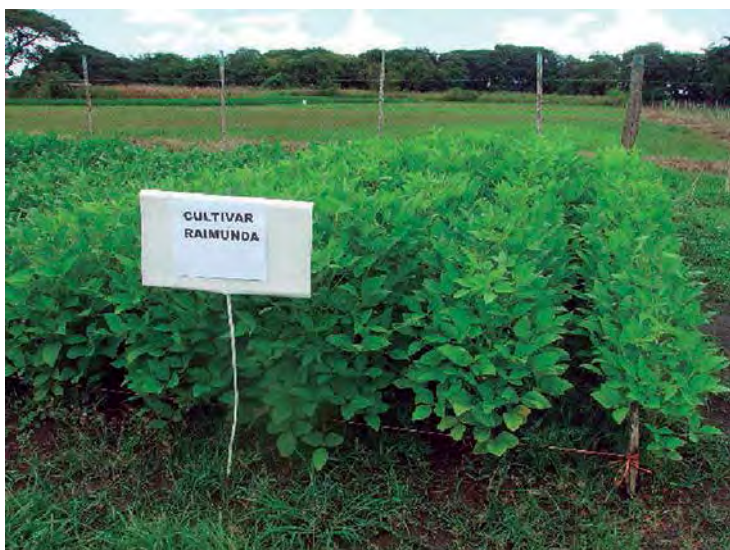
Foto 3. Cultivar BRS Raimunda.