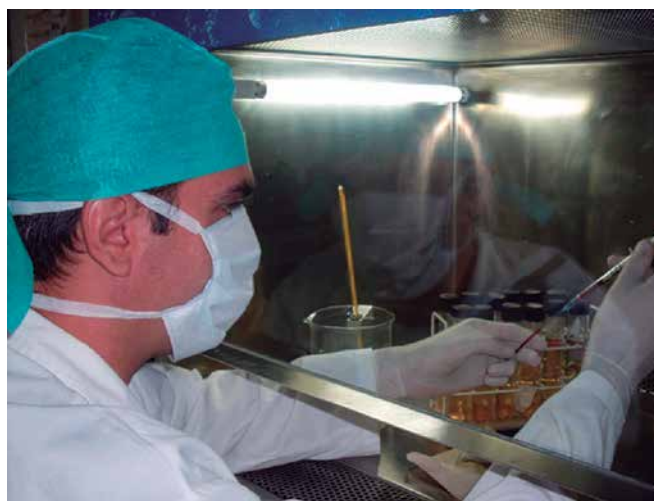
Foto 1. Realización de la prueba de esterilidad de la vacuna. Obsérvese indumentaria y equipos apropiados, como medida de bioseguridad.