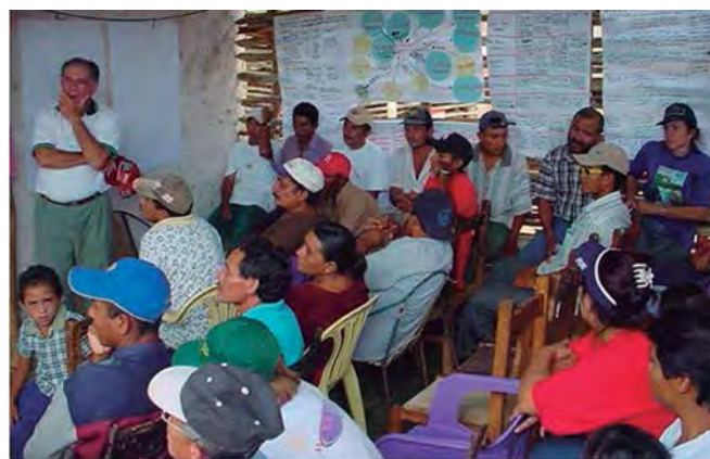
Habitantes de Guamuy narrando su historia.