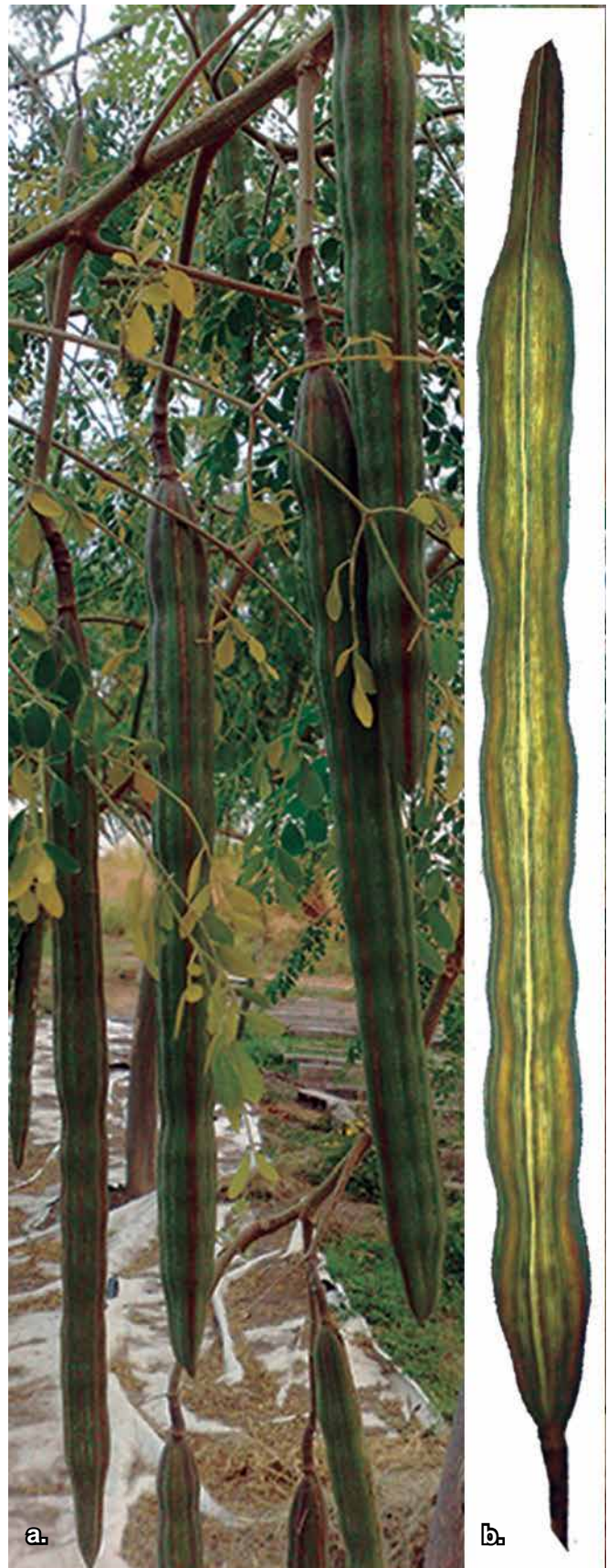
Foto 3. a. Fruto de moringa tierno. b. Fruto maduro.