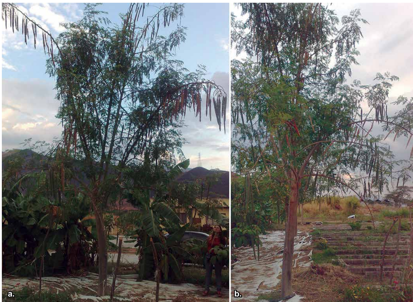
Foto 1 a y b. Árbol de moringa (Cultivos organopónicos INIA-Gerencia General).

Los nombres comunes de la moringa son innumerables entre ellos se pueden mencionar: paraíso blanco, flor de Jacinto, árbol rábano picante, sen,