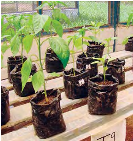
Foto 5. Respuesta de la planta con la combinación de los biocontroladores en comparación con el testigo.