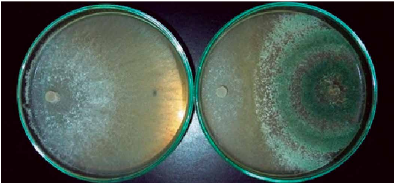
Foto 2. Confrontación del hongo Trichoderma harzianum y Phytophthora capsici .

Si el antagonista posee varios modos de acción reduce el desarrollo de resistencia en el patógeno (fotos 2 y 3). Este riesgo de resistencia también disminuye mediante el uso de combinaciones de antagonistas con diferente modo de acción.