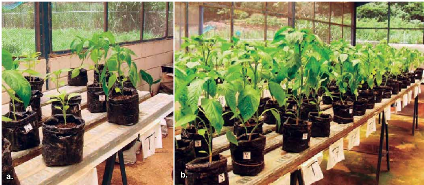
Foto 4. a. Plantas con síntomas de marchitez por Phytophthora capsici . b. Plantas sanas.