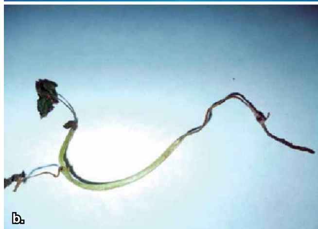
Foto 1. a. Comparación de una planta sana y otra enferma. b. Planta mostrando síntomas de marchitez, pudrición de tallo y raíz característica de la enfermedad.

Los manejos más frecuentes e importantes que se realizan para el control de la marchitez del pimentón, incluye labores culturales efectuando canales de drenaje para evitar la retención de agua, transplantar las plántulas a la parte alta del surco, eliminar las malezas que sean hospederas del patógeno; control químico y control biológico. Dentro de los productos