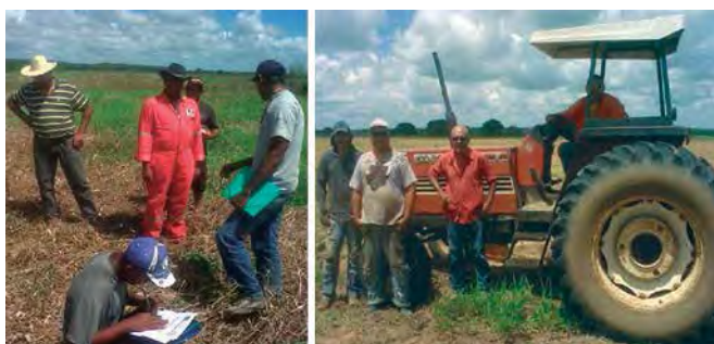
Foto 2. Entrega de reportes de lluvia a productores acreditados en la gran misión AgroVenezuela, sector El Merey, municipio Pedro María Freites, Anzoátegui.