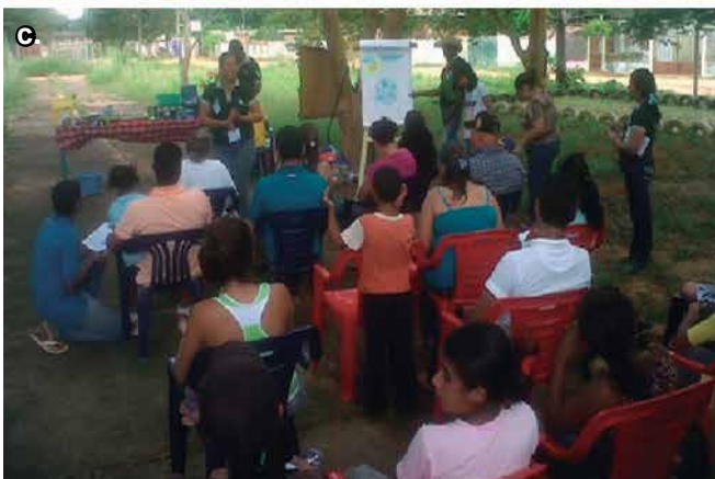
Foto 1 a, b y c. Estudiantes recibiendo cursos de formación en el área de agrometeorología, El Tigre estado Anzoátegui.