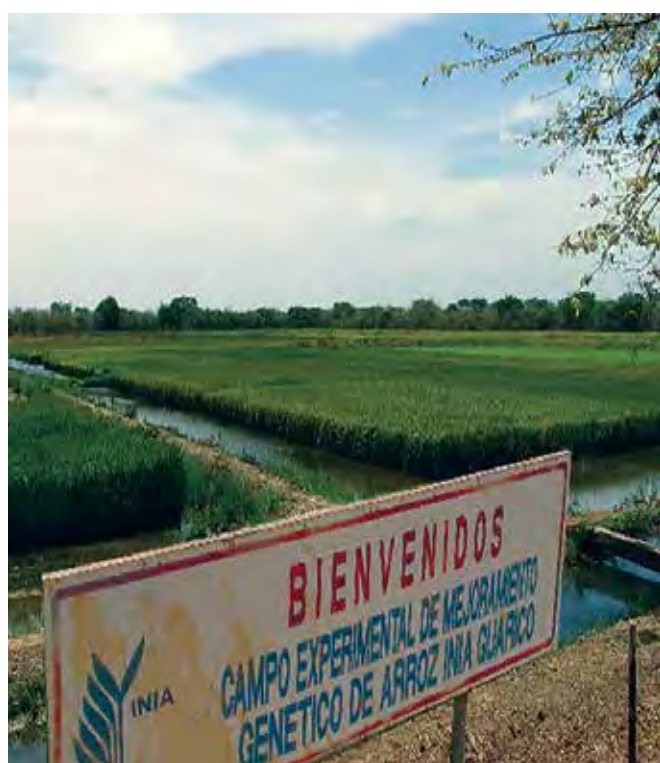
Foto 3. Ensayo de semi-comerciales.