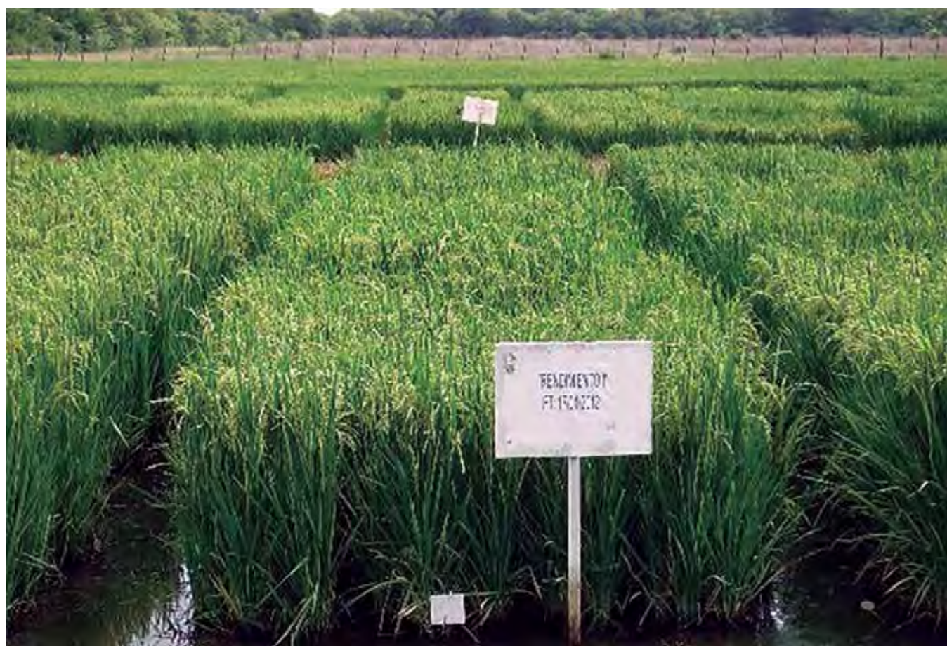
Foto 2. Ensayo de rendimiento II.