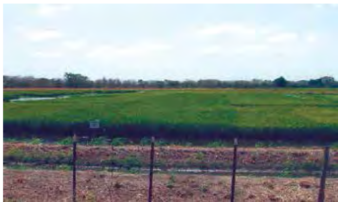
Foto 4. Multiplicación semilla Genética.