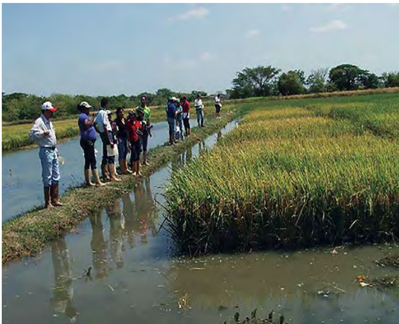
Foto 1. Ensayo de introducción.

Enfocada en dos grandes etapas: la primera involucra desde la selección de los progenitores (caracterización), hibridación o cruces hasta la obtención de líneas generación F_5 ; esta etapa es realizada en el FLAR Colombia con un importante peso del “Proyecto Nacional INIA de Venezuela” en la caracterización y recomendación de progenitores. La segunda , basada en el desarrollo de líneas elites adaptada al país con potencial de ser liberada como nuevo cultivar. Caracterizando la adaptación de estos materiales a través de la implementación de una red de ensayos de rendimiento en las regiones arroceras de importancia en el país (Fotos 1, 2 y 3; Figura).