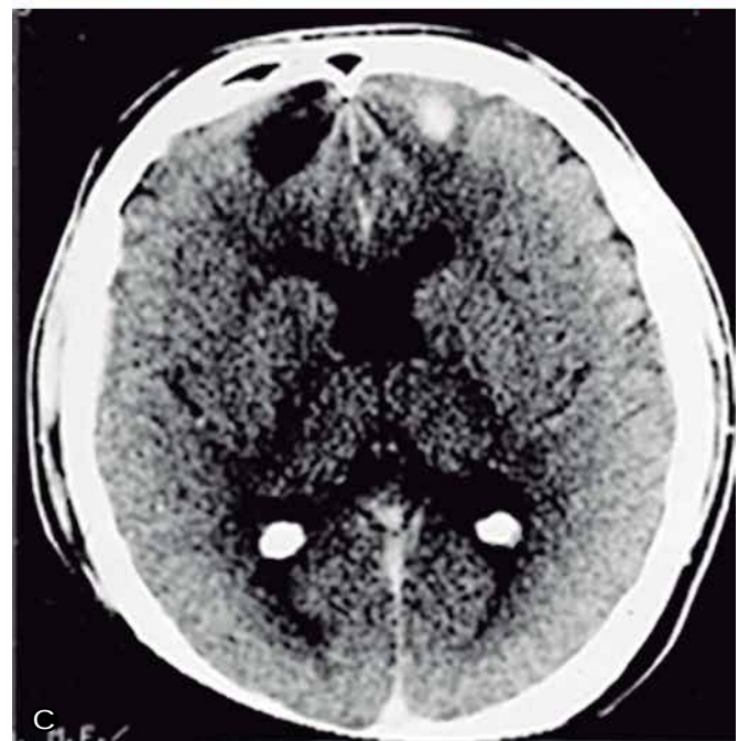
Foto 3. a.) daño en la retina; b.) recién nacido con hidrocefalia y c.) calcificaciones cerebrales.