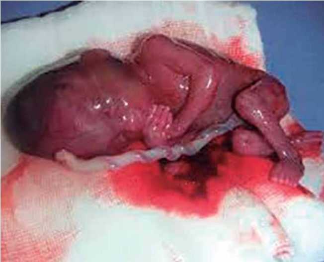
Foto 2. Aborto provocado por toxoplasma gondii .

inmunosuprimidas la toxoplasmosis puede ser fatal; y en las embarazadas, la infección del feto se produce sólo cuando adquiere el parásito durante la gestación, y luego se disemina por la sangre permitiendo la transmisión transplacentaria, lo que puede provocar el aborto (Foto 2).