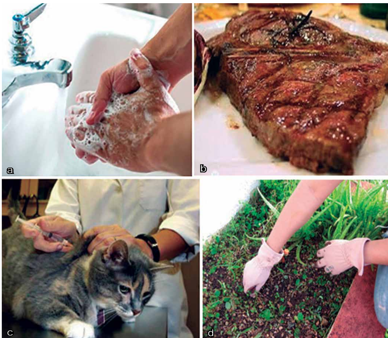
Foto 4. a.) lavado correcto de las manos; b.) carne bien cocida; c.) control veterinario al gato y d.) uso de guantes en jardinería.