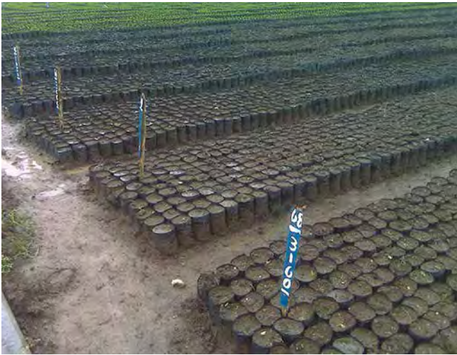
Foto 6. Canteros con bolsas antes del trasplante.

Considerando la cantidad de plantas por vivero en este proyecto, se hizo necesario cuando las bolsas se llenaron y antes del trasplante, aplicar un herbicida pre – emergente, para evitar la competencia de la maleza con la plántula de café en la bolsa. Se utilizaron bolsas de 12 x 24 centímetros, equivalentes a 1 kilogramos de tierra, para asegurar el buen desarrollo radicular de las plantas en el vivero.