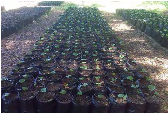
Foto 8. Vivero recién trasplantado.