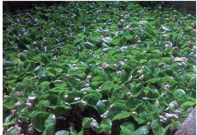
Foto 4. Germinador en chapola.

El lugar de establecimiento del vivero debe ser lo más plano posible y considerando que pueda disponer de agua de forma permanente. En el vivero, la planta permanece de 5 a 6 meses antes de ser llevada al campo definitivamente. En Lara, generalmente el trasplante de los fosforitos a las bolsas de los viveros se realiza en los meses de enero y febrero para que las plantas estén lista para siembra entre mayo a julio (época lluviosa). A la mezcla a utilizar para llenar las bolsas de los viveros, se le realiza un análisis fitopatológico para determinar presencia de nemátodos (Foto 5), pues la mezcla debe estar completamente libre de estos patógenos. La mezcla ideal para llenar las bolsas debe tener una proporción tierra/abono orgánico de 3:1. Los canteros en el vivero se hacen utilizando como medida 10 bolsas de ancho; el largo dependerá de la configuración del terreno, pero siempre con una separación entre canteros de al menos 50 centímetros (Foto 6).