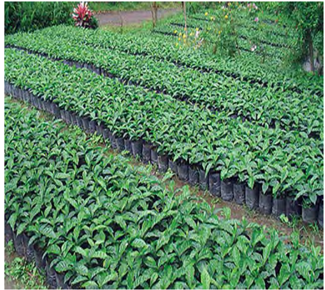
Foto 10. Plantas lista para la siembra en campo.