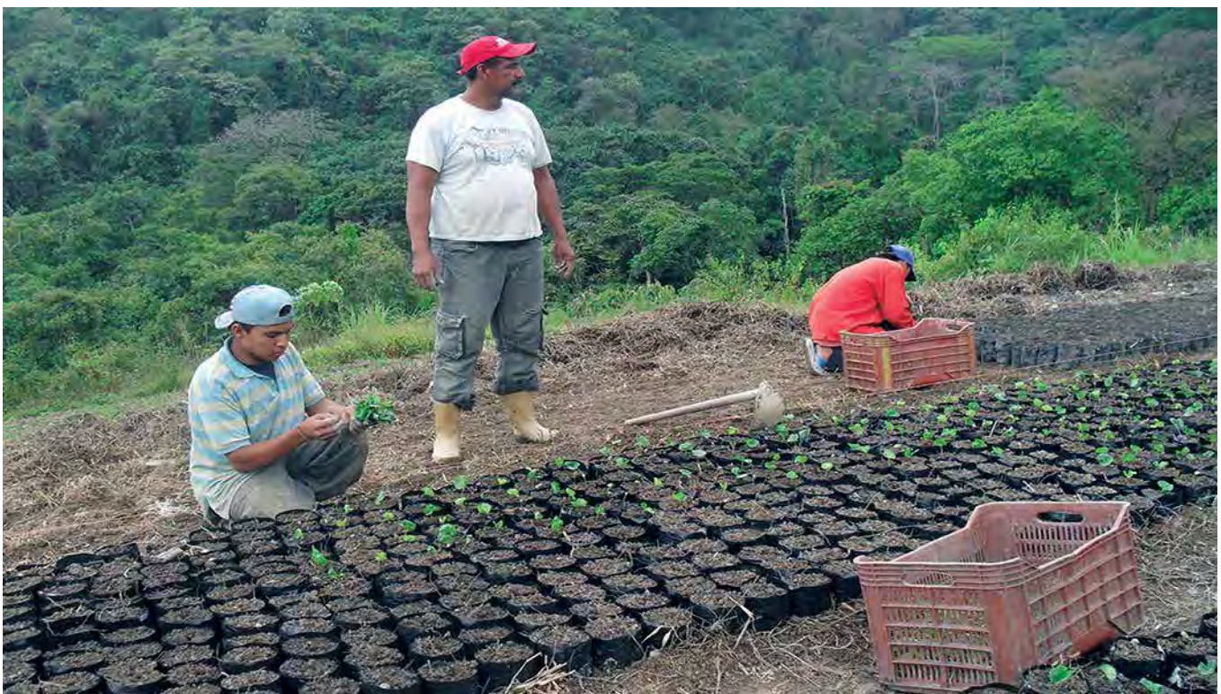
Foto 7. Proceso de trasplante.

A los 20 días después del trasplante se le aplica la primera dosis de fertilizante inorgánico, de fórmula 16-48-00, a razón de 3 gramos por planta y se complementa con la aplicación foliar de humus líquido de lombriz. Repitiéndose nuevamente a los 2 meses. Para hacer más efectiva la fertilización, se realiza una única aplicación al suelo de fijadores de Nitrógeno y solubilizadores de Fósforo al 1%. Antes de salir las plantas de los viveros al campo de los cafetaleros, se realiza un segundo muestreo para determinar presencia de nematodos (Foto 9), y así asegurar y completar la condición fitosanitaria de las plantas a sembrar (Foto 10) y lograr la certificación sanitaria del Instituto Nacional de Salud Agrícola Integral (INSAI).