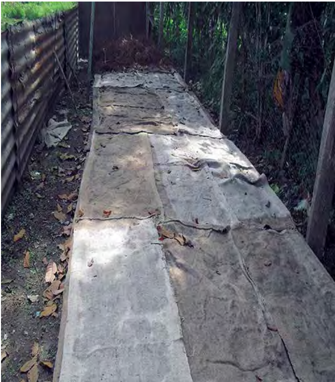
Foto 2. Germinador con cobertura de sacos.

En el estado Lara, los germinadores se establecen en los meses de noviembre y diciembre para poder tener fosforitos o chapolas (Fotos 3 y 4), para trasplante, en los meses de enero a febrero.