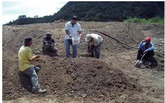
Foto 5. Muestreo de la tierra para análisis nematológico.

El lugar de establecimiento del vivero debe ser lo más plano posible y considerando que pueda disponer de agua de forma permanente. En el vivero, la planta permanece de 5 a 6 meses antes de ser llevada al campo definitivamente. En Lara, generalmente el trasplante de los fosforitos a las bolsas de los viveros se realiza en los meses de enero y febrero para que las plantas estén lista para siembra entre mayo a julio (época lluviosa). A la mezcla a utilizar para llenar las bolsas de los viveros, se le realiza un análisis fitopatológico para determinar presencia de nemátodos (Foto 5), pues la mezcla debe estar completamente libre de estos patógenos. La mezcla ideal para llenar las bolsas debe tener una proporción tierra/abono orgánico de 3:1. Los canteros en el vivero se hacen utilizando como medida 10 bolsas de ancho; el largo dependerá de la configuración del terreno, pero siempre con una separación entre canteros de al menos 50 centímetros (Foto 6).