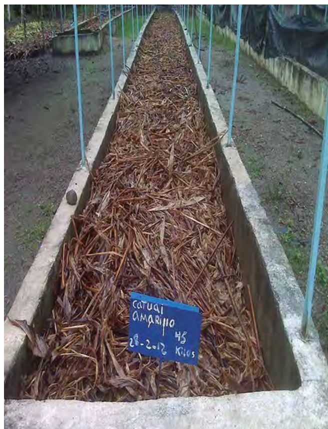
Foto 1. Germinador con cobertura de gramínea.

Sotero o siembra de la semilla: se realiza al voleo y siembra 1 kilogramo de semilla por metro cuadrado de germinador. Esparciendo la semilla de tal manera que tenga buena distribución, y para que no queden colocadas unas sobre otras. Luego se cubre la semilla con una capa de arena de 3 centímetros de espesor, cubriendo con materiales como sacos de sisal, paja seca sin semillas u otro material que permita mantener la humedad (Fotos 1 y 2). Se riega todos los días (evitando aguachinamiento) hasta el momento de la emergencia, que es cuando se levanta la cobertura para facilitar el crecimiento de los fosforitos. La semilla, dependiendo de diferentes factores que afectan su calidad, tarda en germinar de 30 a 45 días.