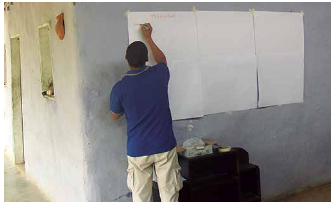
Foto 7. Preguntas orientadoras.