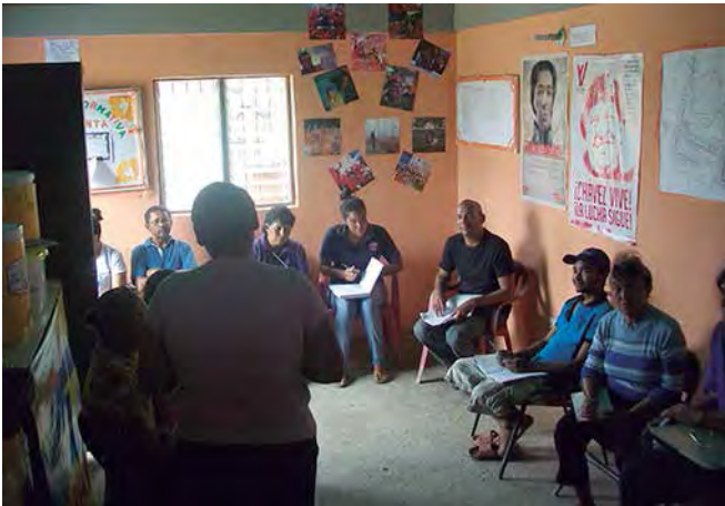
Foto 6. Entrevistas con informantes clave.