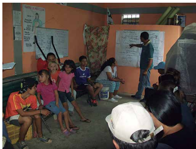
Foto 4. Construyendo la línea Base del Conocimiento.

El método fue utilizado en la evaluación de patios con diferentes condiciones de manejo. Consistía en involucrar a los agricultores y agricultoras urbanas como participantes activos de la evaluación de las unidades de producción a pequeña escala, permitiendo el intercambio de conocimientos entre los técnicos y los agricultores y agricultoras. De esta manera, los productores tenían acceso a las nuevas tecnologías y los técnicos identificaban y comprendían los criterios de los agricultores sobre el manejo de sus huertos familiares. (Foto 8).