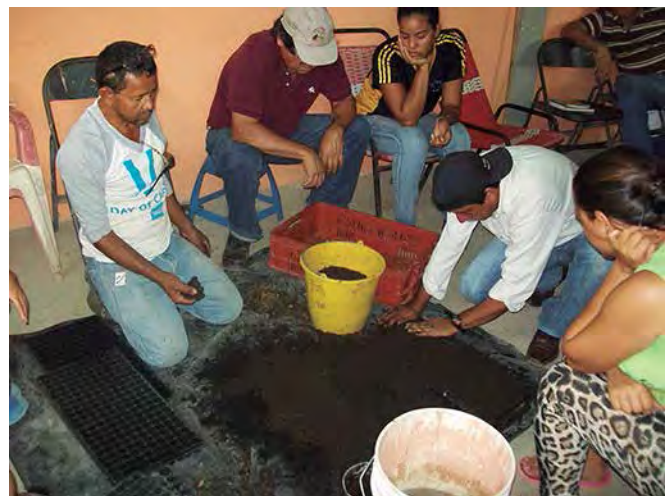
Foto 9. Beneficiarios preparando sustrato para los semilleros.

Así mismo, para la difusión de los resultados se realizaron con cierta periodicidad reuniones con los agricultores y agricultoras urbanas para reflexionar sobre el manejo agroecológico de los huertos familiares y los resultados obtenidos, las experiencias se divulgaron a través de visitas guiadas, intercambios, publicaciones, trípticos, folletos, página web Prensa INIA y Radio Comunitaria.