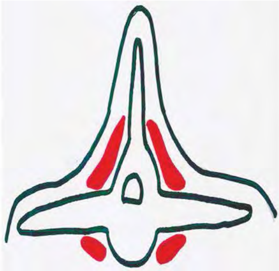
Figura 2. Condición corporal 1 (flaco). Dibujo: Franklin Matute.