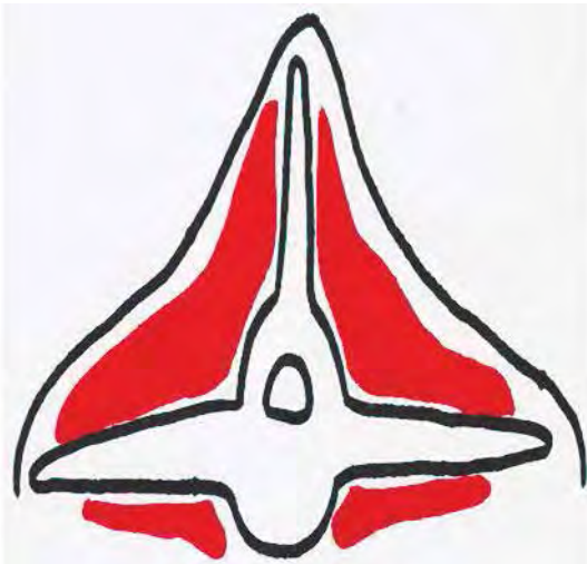
Figura 3. Condición corporal 2 (delgado). Dibujo: Franklin Matute.

La apófisis espinosa es prominente pero suave a la palpación; el músculo del lomo es recto, con poca cobertura de grasa subcutánea, apófisis transversa suave, redondeada; para palpar la cara inferior se debe ejercer una ligera presión. Figura 3.