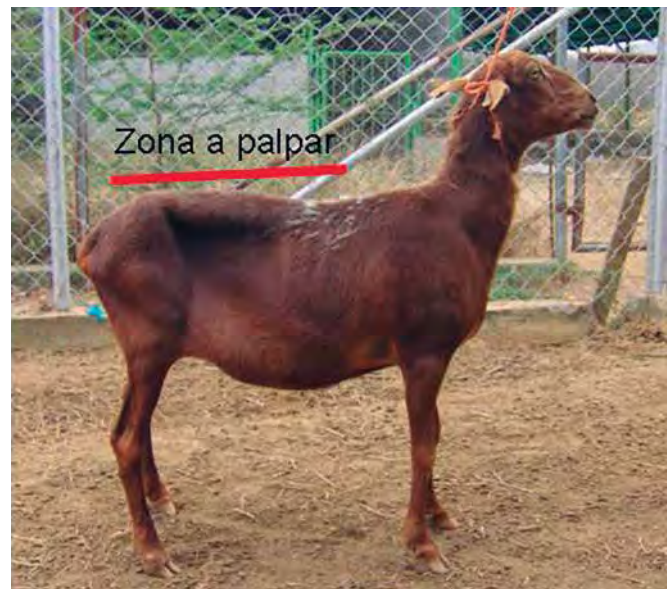
Figura 1. Zona a palpar en el animal.

mada la cantidad de músculo y grasa subcutánea entre las vértebras. Para calificar la condición corporal se utiliza una escala de 1 a 5 propuesta por Russel, (1984). Esta escala permite determinar si los animales están: flacos, delgados, en buena condición, ligeramente gordos u obesos. Es importante destacar que cuando se comienza a evaluar un rebaño, esta técnica debe ser aplicada por un solo evaluador debidamente entrenado, porque la técnica es de apreciación y en consecuencia subjetiva y esto permite además que la pueda realizar de manera mas rápida.