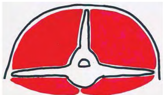
Figura 6. Condición corporal (obeso). Dibujo: Franklin Matute.

Es imposible palpar la apófisis espinosa aunque se ejerza presión, el músculo del lomo está muy lleno con abundante cobertura de grasa, imposible detectar las apófisis transversas. Figura 6.