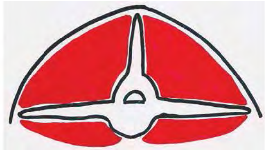
Figura 5. Condición corporal 4 (gordo). Dibujo: Franklin Matute.

La apófisis espinosa es palpada ejerciendo presión y se detectan como línea o cordón duro entre los músculos del lomo, este presenta una buena cobertura de grasa, es imposible palpar la apófisis transversa. Se nota a simple vista grasa en el pecho y base de la cola de los animales. Figura 5.