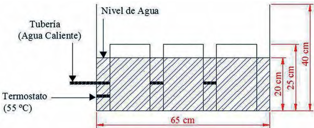
Figura 1. Vista lateral del módulo de compostaje en donde se muestran los recipientes de vidrio y las dimensiones del módulo.

Se determinó el contenido de carbono y nitrógeno para estimar su grado de madurez. Igualmente, se midió los efectos en el desarrollo del cultivo de rábano rojo ( Raphanus sativum L.) como una prueba agronómica para valorar las cualidades de los mismos para ser usados como enmiendas de suelo no contaminantes.