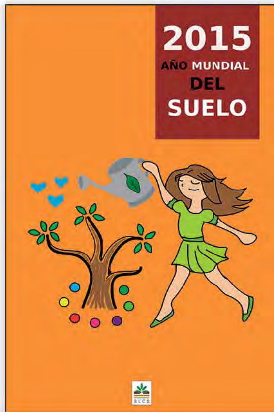
Dirección de Arte: Blanca Miriam Granados Acosta Elaborado por: Carla Guadalupe Anulco Meléndez • Niyelli Berenice García Ariano