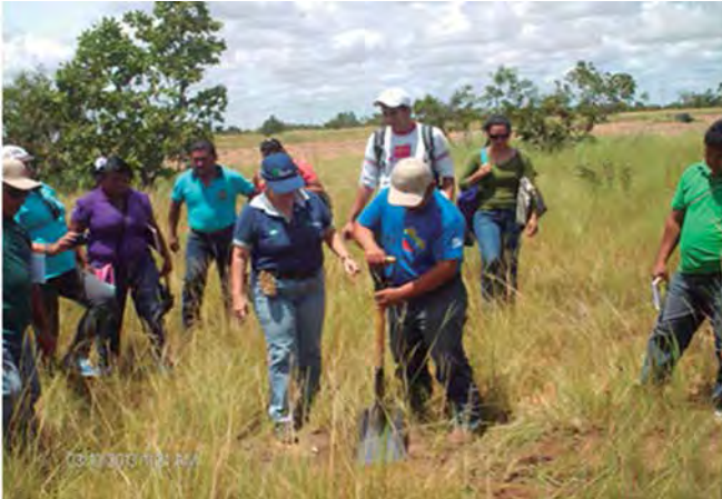
Foto 2. Muestreo de suelos.

manganeso (0,5-12 µg/g), cinc (0,1-1 µg/g), bajo contenido de materia orgánica (0,51 %), aluminio intercambiable de (0,44 meq/100 g d suelo) y conductividad eléctrica de 0,28 ds/m. Los suelos de esta zona corresponden a los órdenes Entisoles, Ultisoles y Oxisoles (grandes grupos Quartzipsamments, Kandistuits y Haplustox).