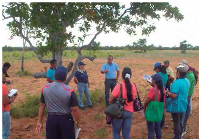
Foto 1. Desarrollo de la gira técnica. Breve explicación sobre el manejo sostenible del suelo en las sabanas orientales.

Posteriormente, se realizó el muestreo de suelos (Foto 2), que desde el punto de vista agronómico, uno de los principales motivos para realizar este análisis es determinar el contenido de nutrientes esenciales para el desarrollo de las plantas, con el firme objetivo de poder recomendar un correcto y económico consejo de abonado consiguiendo además el menor impacto ambiental, derivado a la aplicación de fertilizante únicamente cuando sea necesario y con la cantidad exacta de producto y así lograr ser más sostenibles.