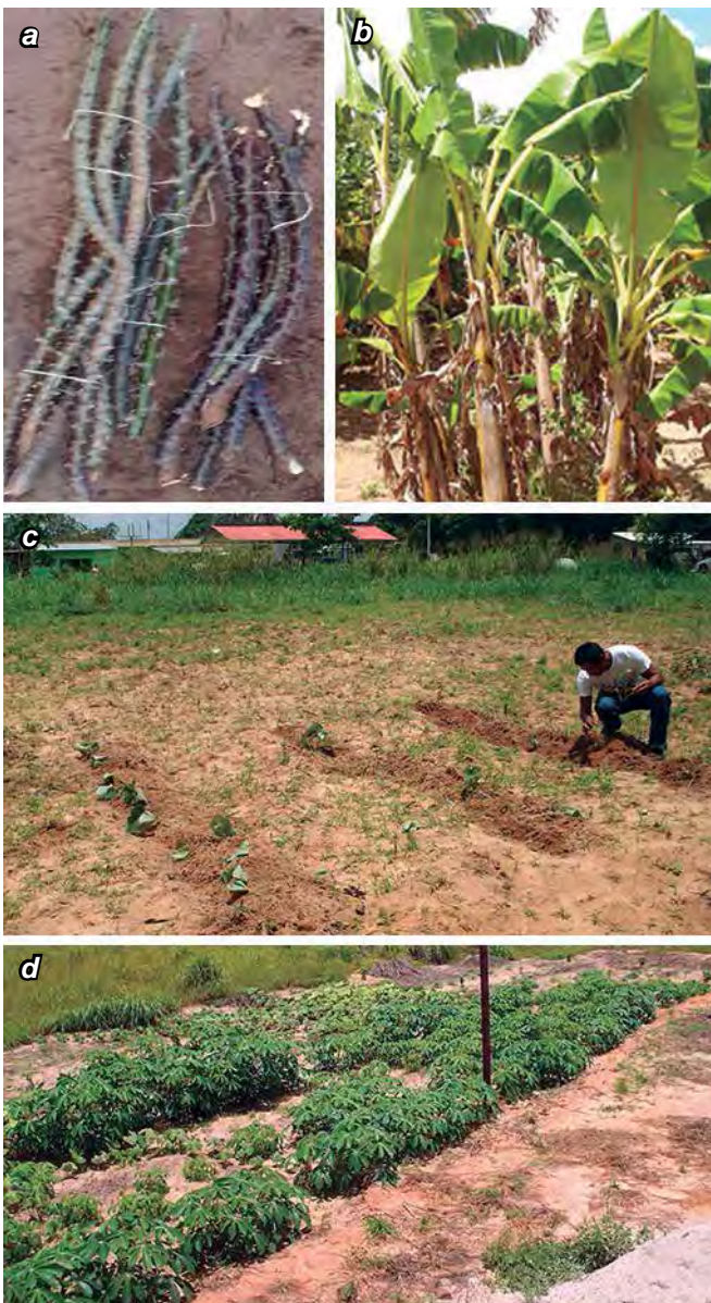
Foto 3 a, b, c y d. Cultivos desarrollados en la comunidad indígena de Kashaama. a) Semillas de yuca amarga ( Manihot esculenta Crantz); b) Plátano ( Musa paradisiaca L) en patio productivo; c) Siembra de semillas de batata ( Ipomoea batatas L) en parcela; d) Cultivo de yuca dulce ( Manihot aipi Pohl).

En este sentido, los huertos familiares eran considerados para la década de los 70 como uno de los sistemas más desarrollados del continente en cuanto tamaño, cuidado y diversidad de plantas cultivadas. Es de notar que aun y cuando las raíces y tubérculos representan los cultivos de mayor proporción, existen huertos familiares constituidos por árboles frutales, algodón, onoto, algunos granos, y ciertas plantas medicinales utilizadas para las enfermedades comunes en la comunidad.