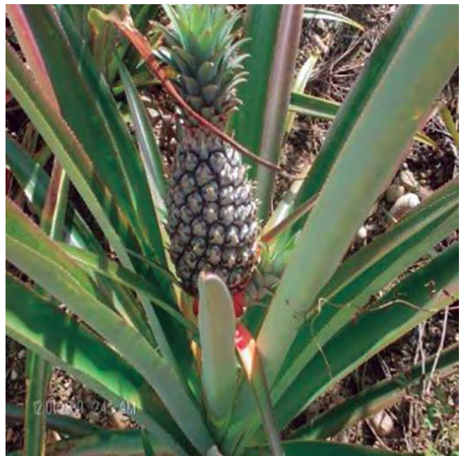
Foto 1. Selección de semilla sana.

Esta es una de las prácticas más importantes, ya que, de ella depende el éxito en la producción; principalmente se debe realizar selección de plantas madres sanas, con buen vigor, libres de enfermedades y plagas; asimismo se recomienda clasificar la semilla por tamaños y establecer lotes de siembra para obtener homogeneidad en la plantación, facilitar su manejo y cosechar lotes completos. Una vez realizada esta práctica, se recomienda la desinfección usando productos que aseguren su efectividad contra enfermedades y plagas importantes, como es el caso de la Cochinilla de la piña Dysmicoccus brevipes . Fotos 1, 2 y 3.