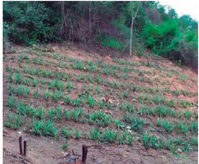
Foto 8. Diseño de plantación en curvas de nivel para evitar erosión en suelo.