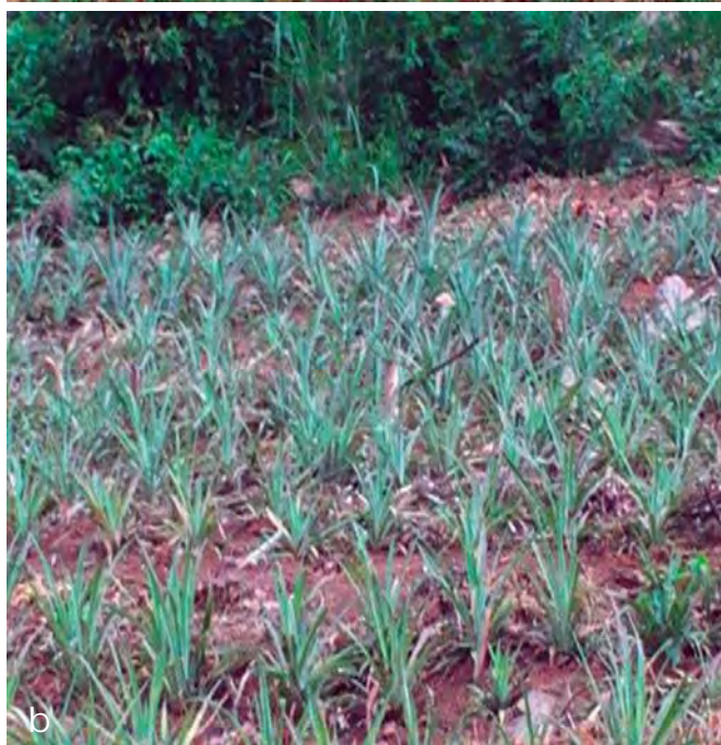
Foto 10 a y b. Sistema de siembra en hileras sencillas.

Hileras dobles o método tecnificado: consiste en sembrar cada hijo o semilla asexual de piña a distancias de 1,50 a 2 metros entre hilera, 40-60 centímetro entre planta y 40-60 centímetros entre doble hilera. Fotos 11 a y b.