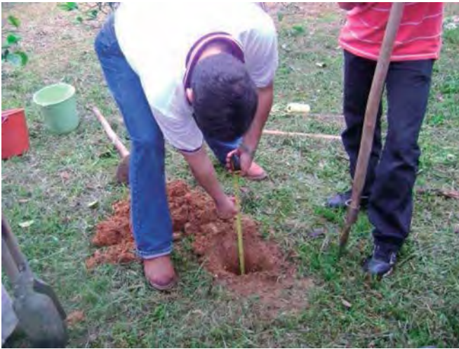
Foto 6. Medición de profundidad de muestreo.