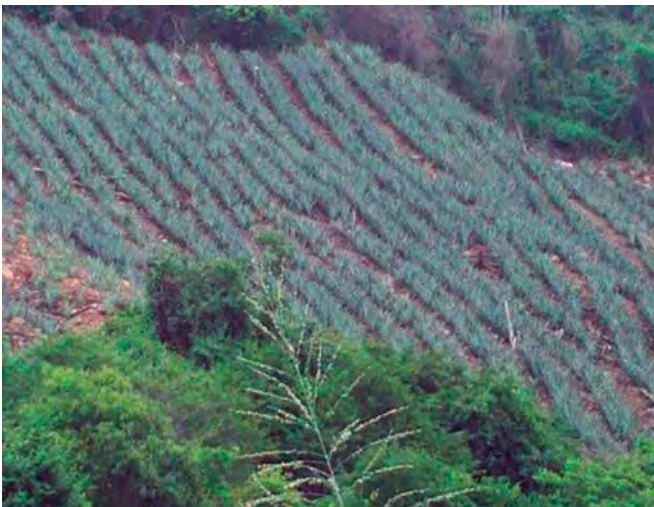
Foto 7. Diseño de plantación proporcional a la pendiente causante de graves daños de erosión al suelo.

En el estado Trujillo la siembra de piña se desarrolla en terrenos inclinados de moderada a fuertes pendientes, usándose en su gran mayoría diseños de plantación a favor de esta, lo que ha causado graves daños de erosión al suelo, que obligan al productor a seguir interviniendo nuevas áreas para sembrar. En vista de esta situación se recomienda la utilización de diseños de plantaciones que corrijan efectos de erosión como es el caso de las Curvas de Nivel con tresbolillo, las cuales consisten en sembrar cada semilla por hilera a una misma altura o nivel con respecto a la siguiente, para ello se utiliza una herramienta denominada y conocida comúnmente como caballete. Fotos 7, 8, 9 a y b.