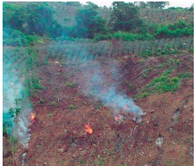
Foto 4. Quema de restos de cosecha por productores en áreas estratégicas.