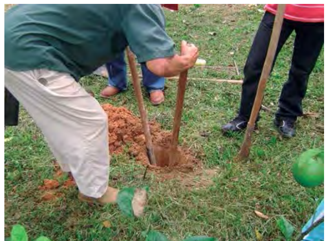
Foto 5. Toma de muestras de suelo con fines de fertilidad.

Es importante realizar toma de muestras de suelo con fines fitopatológicos y de fertilidad por lo menos dos meses antes de sembrar, pues de esta manera se puede conocer a tiempo los resultados de los análisis referentes al pH, macro y micro elementos, materia orgánica y conductividad eléctrica, así como datos físicos de textura y estructura del suelo para realizar las correcciones necesarias durante la preparación del terreno y tomar las precauciones en caso de presentar algún patógeno asociado al cultivo. Fotos 5 y 6.