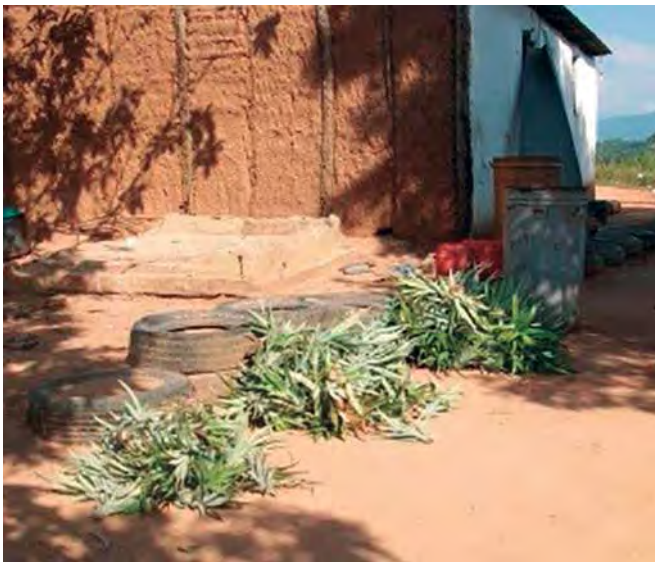
Foto 2. Clasificación por tamaño.