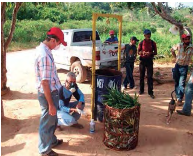
Foto 3. Desinfección de hijos o semilla asexual de piña.