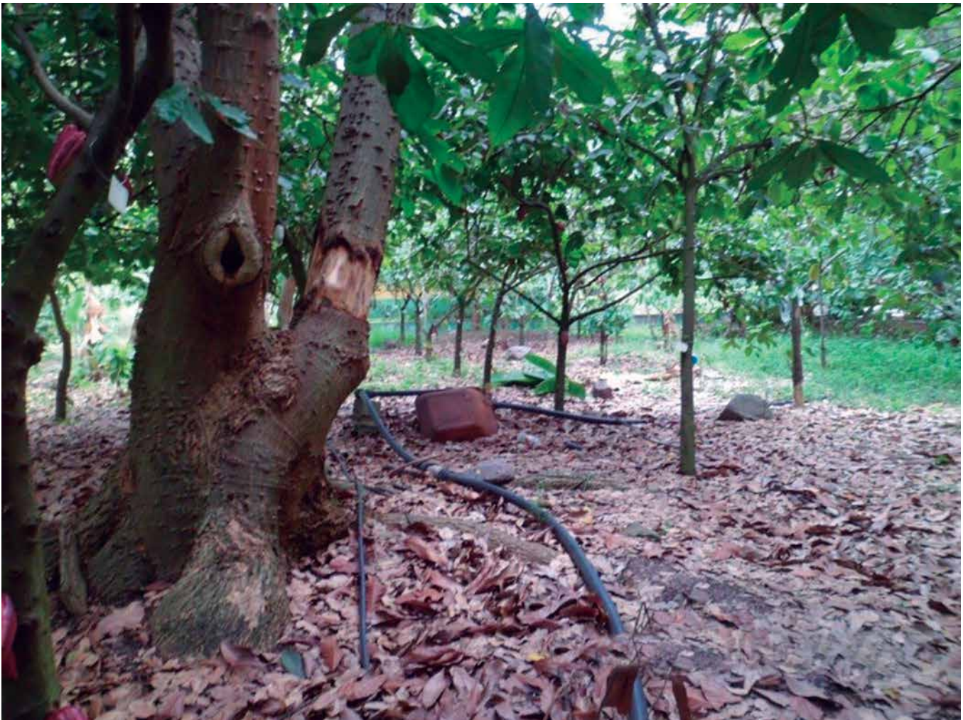
Foto 1. Ecosistema del Banco de Germoplasma de Cacao del Campo Experimental San Juan de Lagunillas del INIA Mérida. Proceso de obtención de B. cepacia .

Así mismo, promueve la actividad y diversidad microbiótica, por ende los procesos biológicos donde participan (fijación de nitrógeno atmosférico, micorrización y solubilización de fósforo), controla la erosión, regenera la cobertura vegetal en suelos degradados y mantiene condiciones de humedad y temperatura adecuados, entre otros (López et al., 2007).