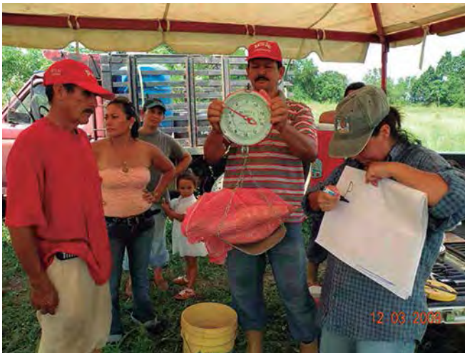
Foto 1. Pesaje de yuca en al aire.