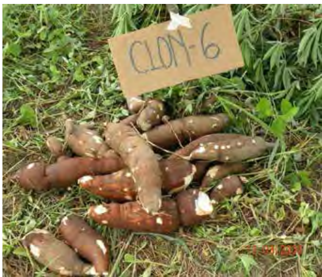
Foto 5. Clon 6.