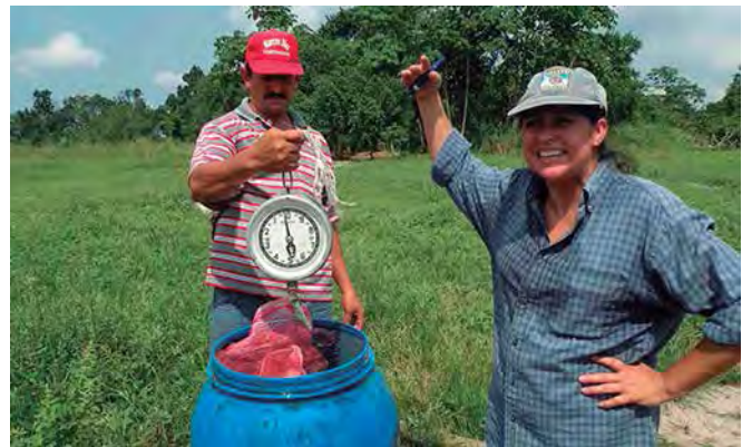
Foto 2. Pesaje de yuca en agua.