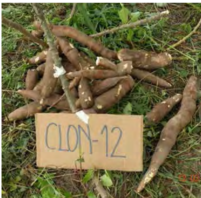
Foto 4. Clon 12.

Para los productores, los mejores clones dulces fueron: clon 12 (60 puntos), clon 6 (58 puntos; Fotos 4 y 5) y los mejores clones amargos fueron: Clon IM225 (59 puntos; Foto 6) y Paiguanera. Lo cual coincide con la evaluación técnica realizada paralela a la participativa. También se procedió a hacer un estudio de degustación (con los mejores clones dulces) para conocer que uso culinario es el adecuado para cada uno. El clon 6 es ideal para fritura por ser más fibroso, el clon 12 es más suave bueno para comer la yuca sancochada.