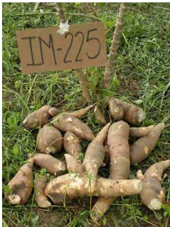
Foto 6. Clon IM225.

El porcentaje de materia seca fue superior a 30% (condición importante para la agroindustria por su relación con el contenido de almidón), en 13 de los 17 clones evaluados, lo que indica que pueden ser utilizados para obtención de almidón. El clon 18 obtuvo los mejores valores de %MS (Figura 2).