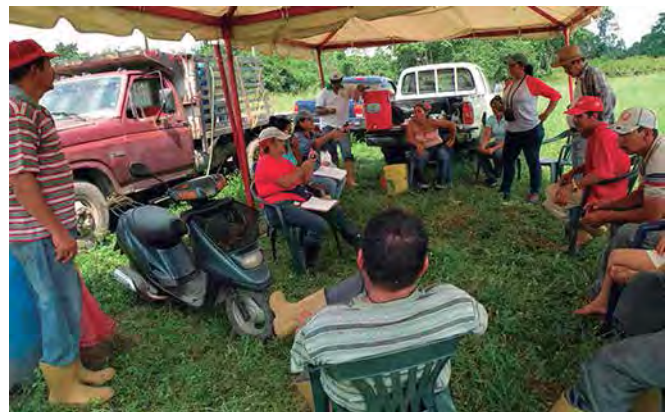
Foto 3. Discusión participativa de los resultados obtenidos.

Se seleccionaron 5 productores dentro del grupo que participó en la cosecha, los mismos asignaron puntuación de 0 a 3 para las categorías: rendimiento, aspecto de las raíces, porte de la planta, resistencia a plagas y enfermedades. Se sumó la puntuación de los 5 productores y se obtuvo la puntuación total para cada clon evaluado (Figura 1), siendo la puntuación máxima a obtener 60 puntos.