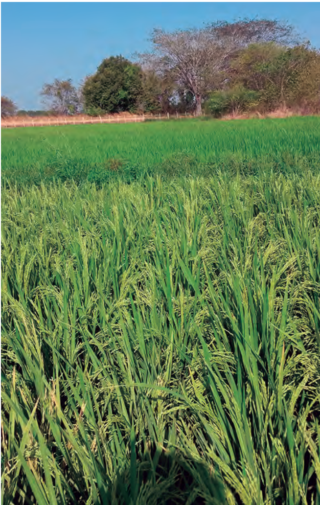
Foto 2. Aspectos de la floración en híbrido.

Definido como el número de días transcurridos desde la emergencia de las plántulas hasta lograr 100% de floración en las parcelas. Aun cuando este carácter esta correlacionado con el ciclo de cosecha, los valores estimados variaron entre 109 a 98 días para el híbrido CT23057H y la variedad Payara FL, respectivamente.