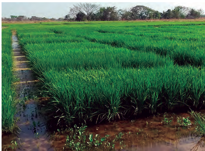
Foto 3. Ensayo de híbridos de arroz en Guárico.

Sin embargo, los resultados en este estudio permiten corroborar que las variedades convencionales en América Latina presentan una alta adaptabilidad que le permite aprovechar ventajosamente las bondades del ambiente para expresar un mejor desempeño, atributos estos que carecen los híbridos de arroz desarrollados por el HIAAL y el IRRI.