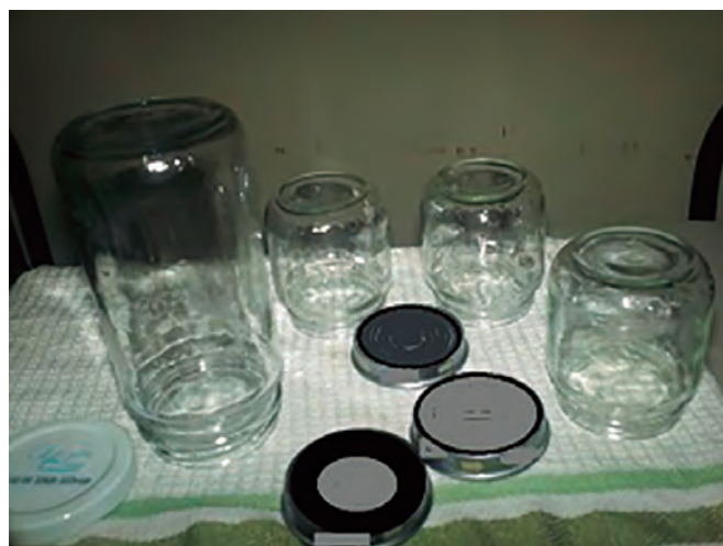
Foto 11. Envases esterilizados para adicionar la mermelada de cauji.

Etiquetado: las etiquetas se pegaron cuando los envases estuvieron a temperatura ambiente y se verificara la gelificación de la mermelada tal como lo indica la norma COVENIN, 1989.