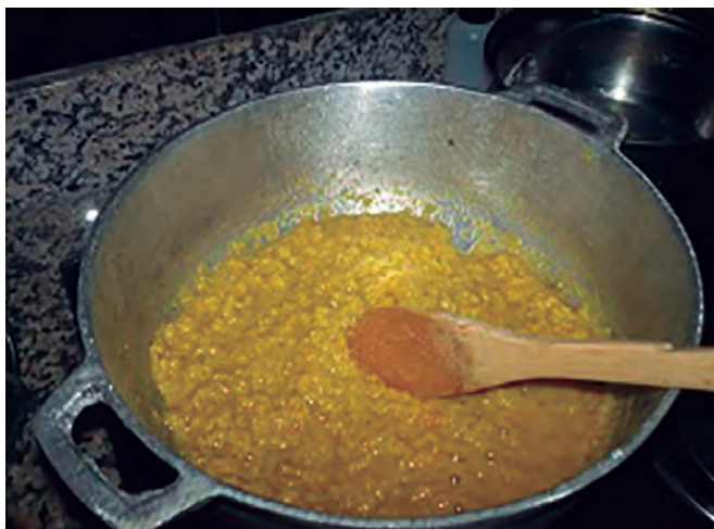
Foto 10. Cocción de la mermelada.

das anteriormente, se llevó a ebullición y se adicionó el azúcar lentamente, luego el ácido cítrico y finalmente gelatina comercial sin sabor. Ésta última se mezcló bien con un tercio del azúcar (A), y se agregó lentamente mientras se agitaba la mermelada. Se dieron 5 minutos más de calentamiento hasta que se alcanzaron los 65 °Brix. En este punto se retiró la olla de la fuente de calor y tomó una muestra de la mermelada. Se enfrió hasta 25 °C, procediendo a medir el pH para constatar que estaba entre 3,0 y 3,5. Finalmente, pesó la mermelada obtenida. Esta etapa duró de 30 a 40 minutos aproximadamente (Foto 10).