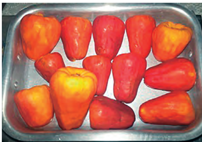
Foto 3. Pseudofrutos de caujiil lavados, listos para procesar.

En el Cuadro 1 se muestran los datos obtenidos de los pesos correspondientes de la materia prima en el momento de la recepción en el laboratorio con y sin la nuez (Foto 3), para luego ser refrigerados y aplicarles los análisis físico-químicos correspondientes. La cantidad de pseudofrutos recolectados fueron de 15,2 de los cuales se utilizaron para determinarles humedad. Los datos de la pesada de los 13 pseudofrutos de caujiil a procesar están en el Cuadro 1, y en la Foto 4 se observa el procedimiento de pesada.