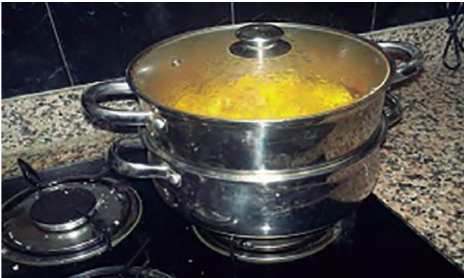
Foto 5. Escaldado de la fruta cortada.

Preparación preliminar: los pseudofrutos de caujiil previamente lavados con agua clorada se cortaron en pedazos pequeños con cuchillo de acero inoxidable esterilizado. Se escaldaron a vapor (95°C) de 5 a 8 minutos (Foto 5) y luego se procedió a licuarlos, utilizando una licuadora de alta revolución (Foto 6). El jugo obtenido se filtró utilizando un colador con malla plástica, para separar partículas de cáscara y fibra del caujiil (Foto 7).