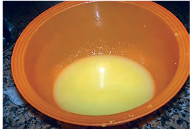
Foto 8. Jugo colado del pseudofruto de caujiil.

Clarificación: obtenido el jugo (Foto 8) se procedió a clarificarlo espolvoreando 1 gramo de gelatina comercial sin sabor, a temperatura ambiente, la mezcla fue agitada, para luego dejar reposar por espacio de 15 minutos hasta ver coagulación en la superficie del líquido. Una vez clarificado el jugo se procedió al filtrado en un colador de tela de algodón tipo gasa (Foto 9).