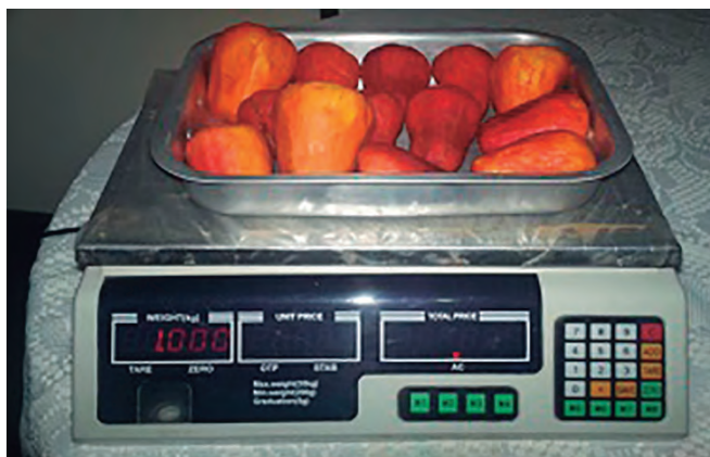
Foto 4. Pesada de los pseudofrutos de caujiil a procesar.

Se siguió el procedimiento sugerido por CODEX Alimentarius (2004), a excepción de del tiempo de cocción, el cual fue menor para el pseudofruto del caujiil debido a que un tiempo más prolongado al planteado en este procedimiento, produce una deshidratación excesiva de la pulpa y oscurecimiento debido a la oxidación (un diagrama de flujo del procedimiento, puede apreciarse en la Figura 1).