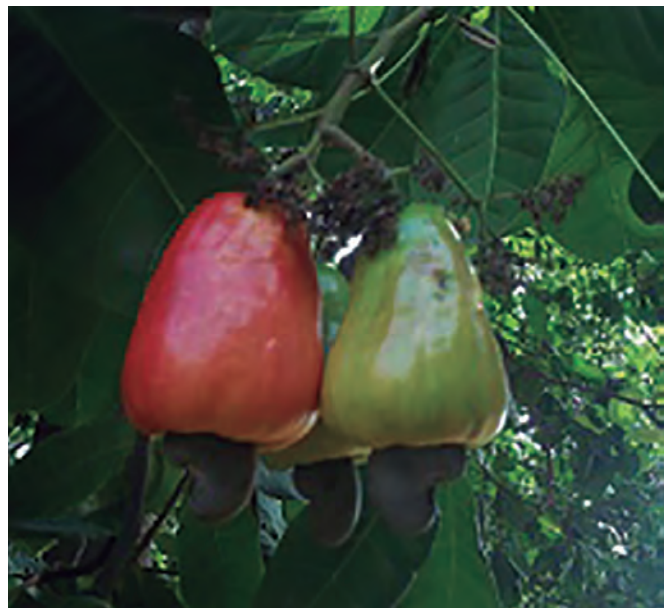
Foto 2. Frutos sin daño físico, con un adecuado estado de madurez (izquierda) y sin adecuado estado de madurez para este estudio (derecha).

dróxido de sodio en presencia de fenolftaleína como indicador. Los resultados se expresaron en gramos del ácido predominante en la fruta en 100 gramos de producto (COVENIN, 1977).