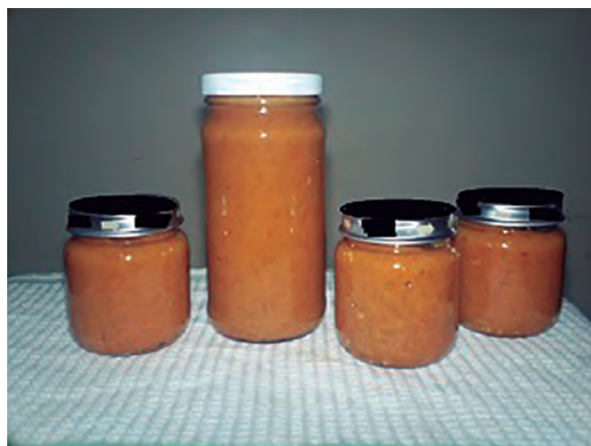
Foto 12. Mermelada de cauji envasada.