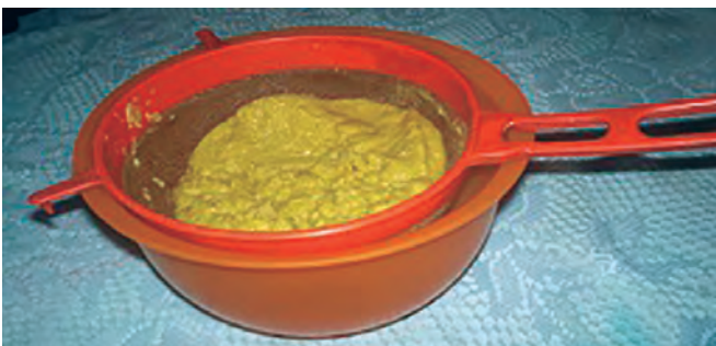
Foto 7. Colado de la pulpa del caujiil.

Clarificación: obtenido el jugo (Foto 8) se procedió a clarificarlo espolvoreando 1 gramo de gelatina comercial sin sabor, a temperatura ambiente, la mezcla fue agitada, para luego dejar reposar por espacio de 15 minutos hasta ver coagulación en la superficie del líquido. Una vez clarificado el jugo se procedió al filtrado en un colador de tela de algodón tipo gasa (Foto 9).