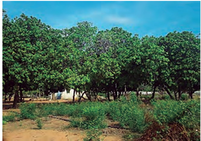
Foto 1. Árboles de cauji en el lugar de recolección de los pseudofrutos (comunidad Las Mercedes, parroquia San Isidro, estado Zulia).

Determinación de la acidez titulable (AT): la muestra se tituló con una solución alcalina de hi-