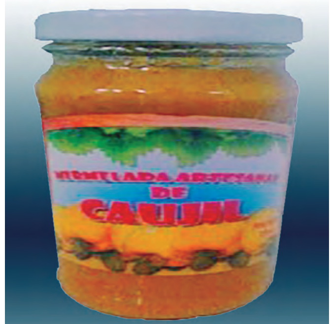
Foto 13. Presentación de la mermelada artesanal de caujiil.

La Foto 13 muestra la presentación de la mermelada en el frasco de vidrio etiquetado con una capacidad de 370 gramos. Presenta un color naranja parduzco brillante, por efecto de la oxidación durante el cocimiento en paila al aire libre y al tiempo que tardó expuesta la misma. Tendrá un tiempo de almacenamiento de 1 año aproximadamente en ambiente fresco y oscuro.