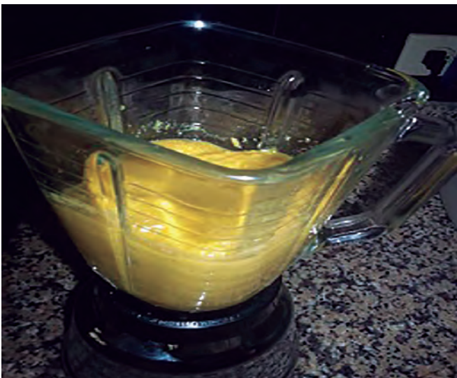
Foto 6. Licuado de la pulpa del pseudofruto de caujiil.