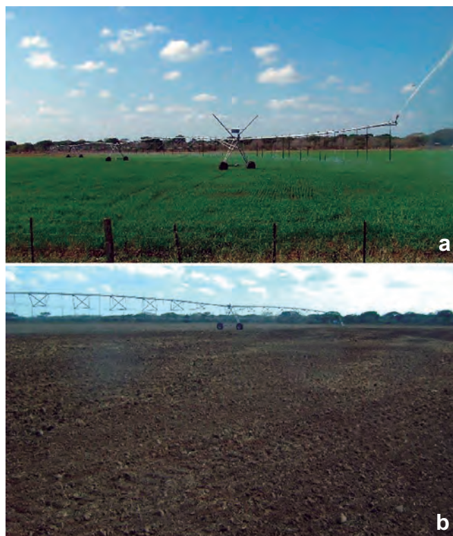
Foto 3 a y b. Campo de semilla registrada de 'Soberana FL' bajo SD y RP pivote central.

La preparación del suelo consistió de dos pases de rastras y uno de viga. La siembra se realizó con sembradora mecanizada a dosis de 60 kilogramos por hectárea en distancia entre surcos de 0,17 metros (Foto 5 a y b) Posteriormente, fue aplicado un riego de germinación a una lámina de 14 milímetros. El primer control de maleza pre-emergente se utilizó: Round Up (3 lt/ha); Combo (1/2 dosis); 2-4D (2 lt/ha), en razón que había presencia de malezas tanto de hoja ancha como de gramíneas. El Segundo control de malezas a los 5 días de la siembra se realizó con Ronstar (1,6 lt/ha); Round Up (3 lt/ha); Combo (1/4 dosis); Ally (1 dosis).