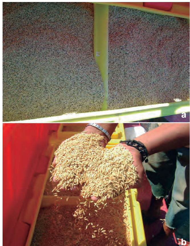
Foto 2 a y b. Semilla fundación 'Soberana FL'.