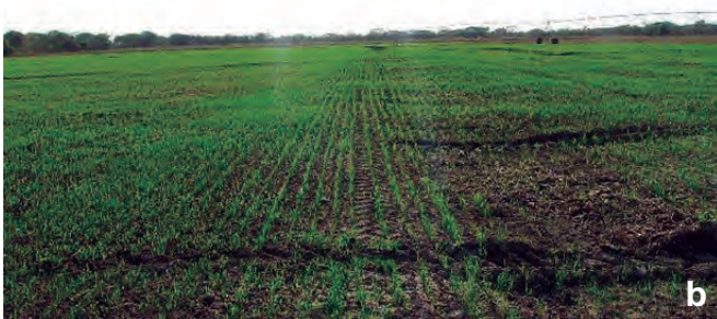
Foto 5 a y b. Germinación del campo semilla Registrada 'Soberana FL'.