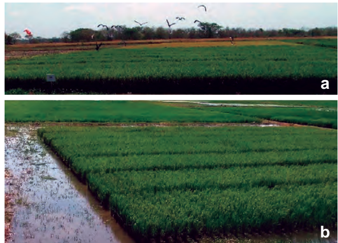
Foto 1 a y b. Bloques de multiplicación de semilla fundación 'Soberana FL'.

de siembra por trasplante en bloques de multiplicación (Foto 1 a y b). El análisis de calidad fisiológica de semilla arrojó los siguientes valores: germinación 94%, plantas anormales 2%, semillas muertas 2%, semillas no germinadas 2%, semillas nocivas 0%, semilla de malezas 0%, concluyendo semilla de alta calidad física y genética (Foto 2 a y b).