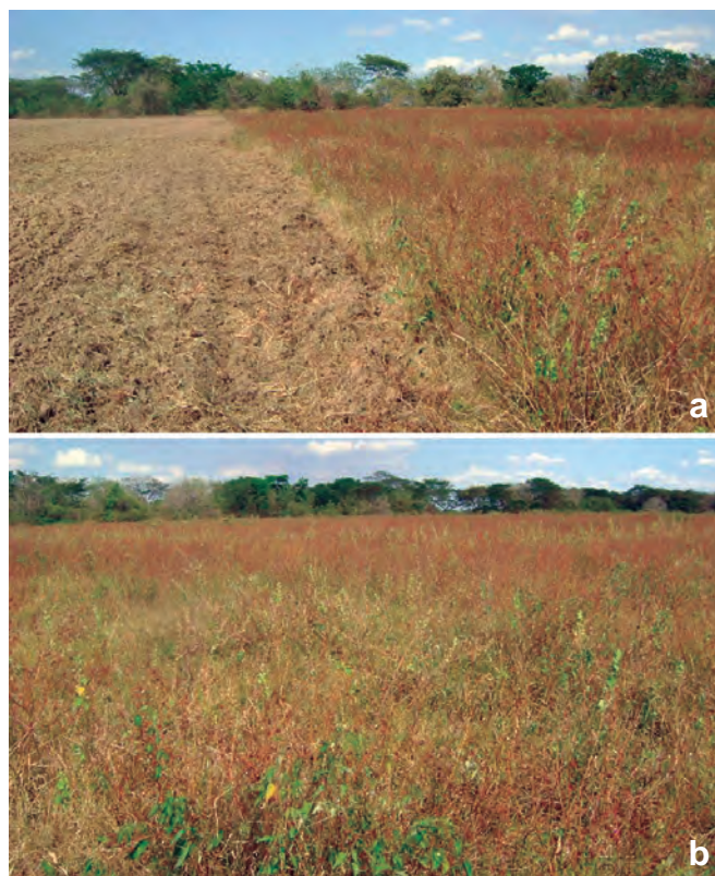
Foto 4 a y b. Vegetación natural del potrero 1 del Campo Experimental INIA Guárico.