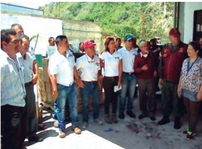
Foto 5. Instituciones participantes en el reconocimiento público del Consejo de Productores del estado Táchira.

El modelo reflejó la ampliación de los derechos de los productores que hacen vida en la organización, logrando obtener el financiamiento para pequeños y medianos productores por parte de Fondo para el Desarrollo Agrario Socialista (FONDAS) y Banco Agrícola de Venezuela (BAV), regularización del 89% de las tierras existente en la comunidad, a través del Instituto Nacional de Tierras (INTI), fortalecimiento de los sistemas de riego mediante el Instituto Nacional de Desarrollo Rural (INDER), y asesoramiento técnico integral por parte del INIA Táchira, Foto 5.