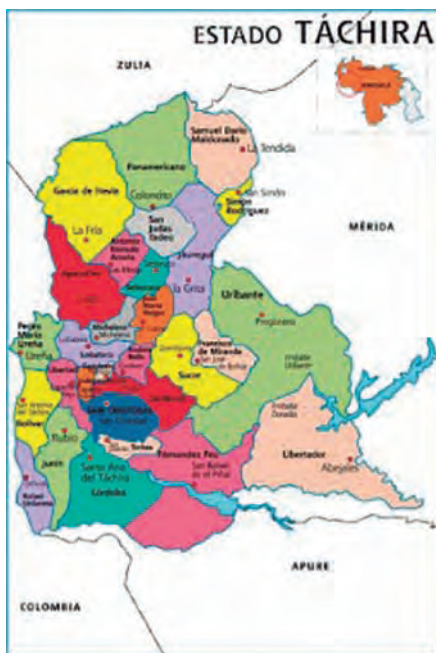
Figura 2. Mapa territorial del estado Táchira.