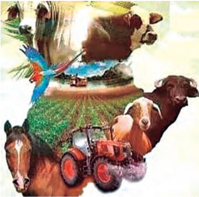
Figura 1. Logo del Consejo Campesino Pedro María Ureña.

El modelo reflejó la ampliación de los derechos de los productores que hacen vida en la organización, logrando obtener el financiamiento para pequeños y medianos productores por parte de Fondo para el Desarrollo Agrario Socialista (FONDAS) y Banco Agrícola de Venezuela (BAV), regularización del 89% de las tierras existente en la comunidad, a través del Instituto Nacional de Tierras (INTI), fortalecimiento de los sistemas de riego mediante el Instituto Nacional de Desarrollo Rural (INDER), y asesoramiento técnico integral por parte del INIA Táchira, Foto 5.