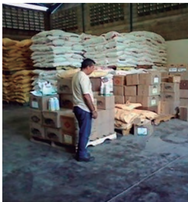
Foto 4. Insumos destinados para el Consejo de Productores de Táchira.