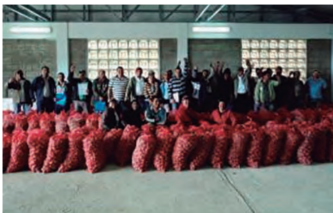
Foto 1. Directiva del Consejo de Productores.

Luego, a través de herramientas de planificación estratégica situacional, se ejecutaron acciones específicas que impactaron de manera determinante en los nudos críticos identificados junto a los sujetos participantes mencionados anteriormente, es así como, es constituido el Consejo de Productores y Productoras Campesinos y Campesinas de la comunidad de las Quebradas parroquia Isaías Medina Angarita (Foto 2 a, b y c), integrado este por 36 productores, siendo la organización pilar para la masificación de este método en el municipio Junín y posteriormente todo el estado Táchira, (Foto 3 a y b; Foto 4 y Figura 1).