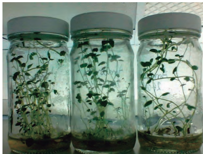
Foto 3. Vitroplantas de papa obtenidas en medio MS líquido a los 21 DDS.

A los 21 días después de la siembra, en los frascos con medio de cultivo Murashige y Skoog líquido, se obtuvieron vitroplantas bien formadas con 5 a 7 yemas y con el sistema radicular desarrollado, independientemente de la variedad, seguidas en tamaño y desarrollo por las plantas sembradas en el medio de cultivo Murashige y Skoog con agar. Las plantas sembradas en medio con SOLUB® 13-40-13 presentaron menor crecimiento. (Foto 3).