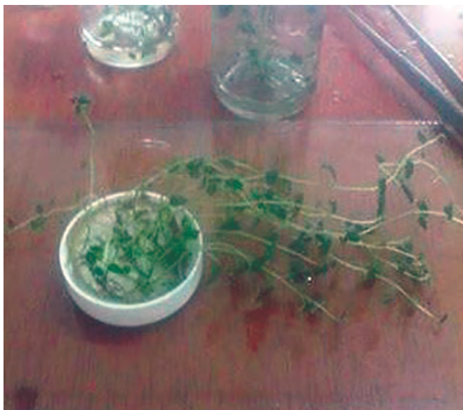
Foto 1. Vitroplantas utilizadas para seccionarlas en trozos o segmentos.