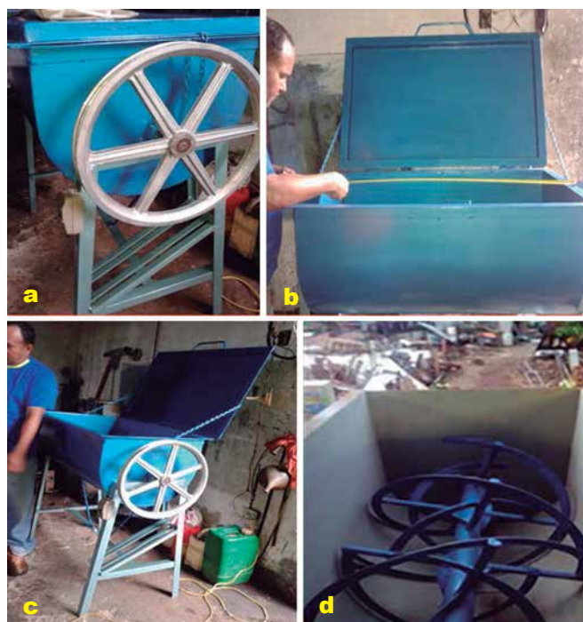
Foto 4 a, b, c y d. Mezclador artesanal de tornillo sin fin.

El eje sin fin trae acoplado paletas de manera zigzajeante que permite mezclar de manera efectiva la fórmula alimentaria y traslada el material al dispensador. La estructura de soporte está construida con material de alto calibre que garantiza la durabilidad y el sostén del túnel de mezclado y el peso requerido de acuerdo a su capacidad de producción. Capacidad: 250-350 kg/h. Potencia del motor: 2 hp. Dimensiones del embalaje: 1,3 m x 0,90 m x 0,88 m. Peso: 90 kilogramos.