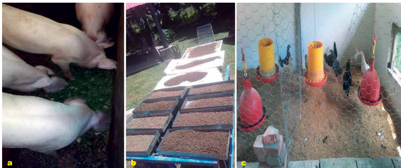
Foto 8 a, b y c. Alimento obtenido y suministrado a aves y cerdos.