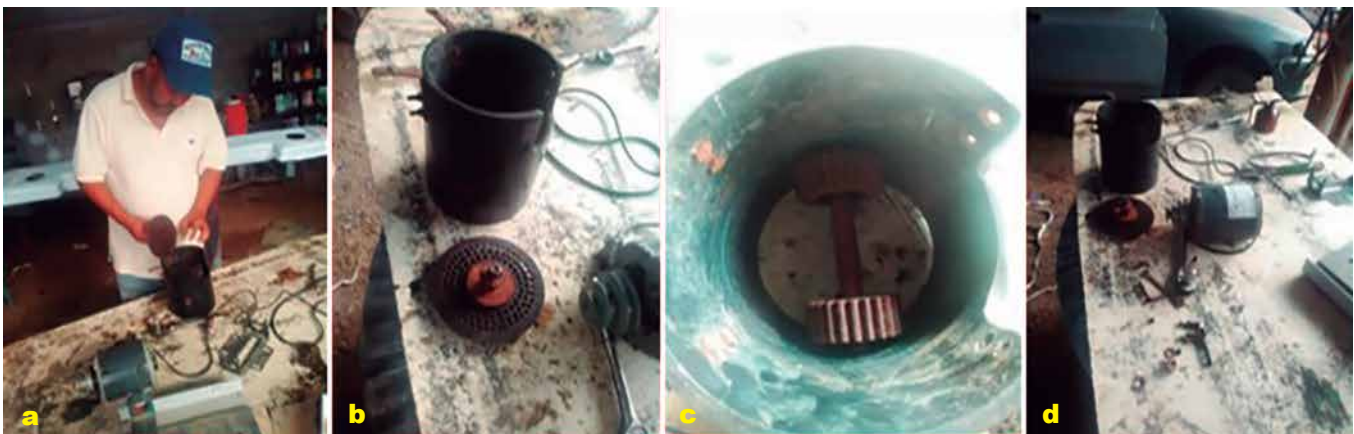
Foto 6 a, b, c y d. Componentes del pelletizador de disco horizontal.