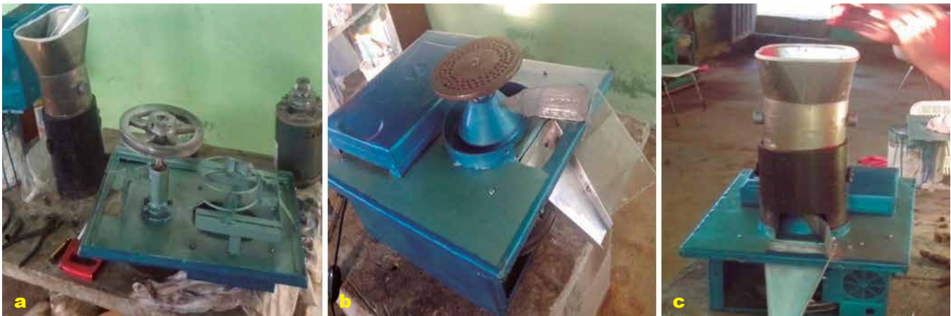
Foto 5 a, b y c. Construcción artesanal de la pelletizadora.

necesidades y recursos, cuyo costo es inferior o igual al que pueda ofrecer el mercado establecido, y que cumple las especificaciones requeridas para la elaboración de alimentos balanceados pelletizados. Engranajes de transmisión de acero de alta calidad, eje diseñado para soportar fuertes propulsiones y fuerzas axiales para conseguir una duración más larga. La prensa de pellets utiliza un rodillo de gran diámetro apto para grandes producciones, alta proporción de pelletización y para fabricar pellets de larga duración. El rodillo y el troquel plano funcionan uniformemente, y se pueden utilizar las dos caras del troquel plano para conseguir un mayor aguante. Todos los cojinetes están sellados a fin de prevenir la acumulación de polvo y propiciar una alta eficiencia y durabilidad. El usuario puede elegir entre pellets de 6 a 12 milímetros de diámetro. Capacidad: 250-350 kg/h. Potencia del motor: 22 kilovatios. Dimensiones del embalaje: 1300 x 600 x 1400 milímetros. Peso: 45 kilogramos, (Foto 6 a, b, c y d).