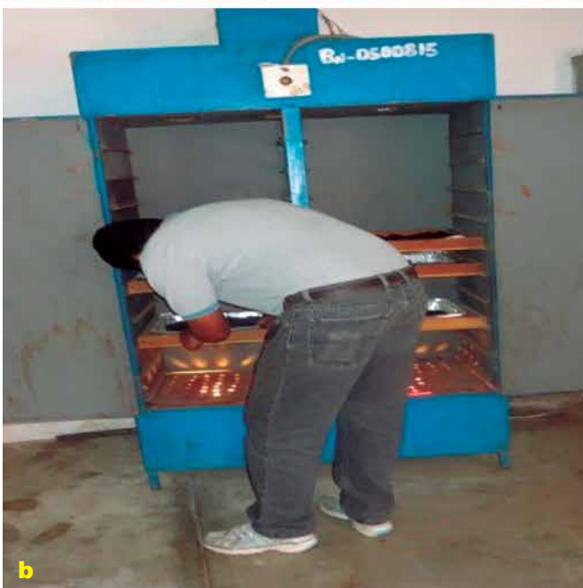
Foto 1 a y b. Secador artesanal.