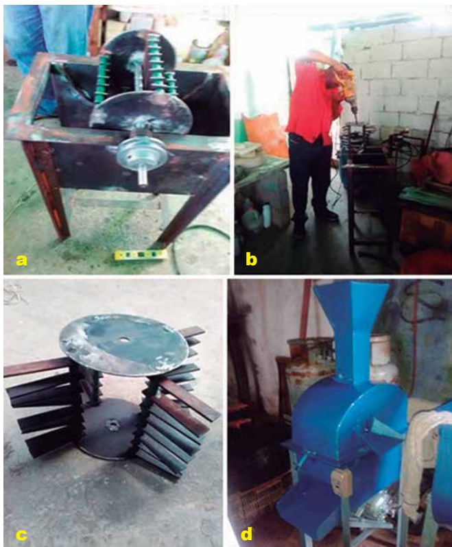
Foto 3 a, b, c y d. Construcción de molino martillo y cuchillas.

Los 4 ejes de martillo se fabricaron en pletina, jnhun distribuidos equitativamente para alcanzar el equilibrio de balanceo en proporciones de 4 martillos por eje. Caja metálica para garantizar que no se pierda los granos o el material a moler y picar. El trabajo de molienda es propulsado por un motor de 2,5 hp que girará los ejes de martillos para que trituren y muelan el material a mezclar para la formulación. Capacidad: 250-350 kg/h. Potencia del motor: 220 kilovatios. Dimensiones del embalaje: 1300 x 600 x 1400 milímetros. Peso: 75 kilogramos, (Foto 3 a, b, c y d).