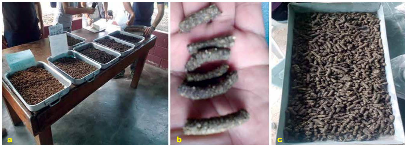
Foto 7 a b y c. Pellets obtenidos por el equipo artesanal.

El uso de estos equipos artesanales permite procesar materias primas no convencionales como moringa, mata de ratón, leucaena, samán, morera, hojas y raíces de yuca y batata, entre otras, para alimentación animal que la industria en ningún momento las procesa, y por ende potenciar la producción de proteína animal barata.