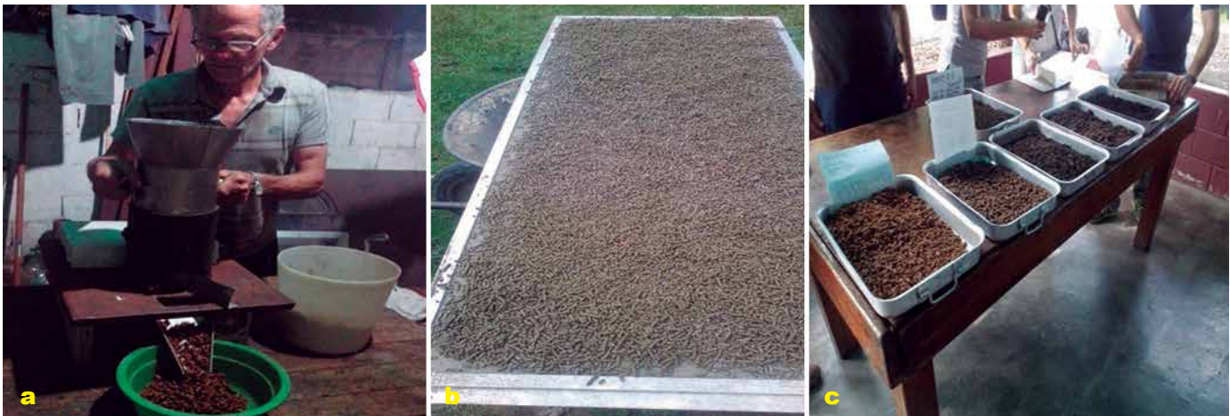
Foto 2 a, b y c. Producción de alimentos formulados para animales.