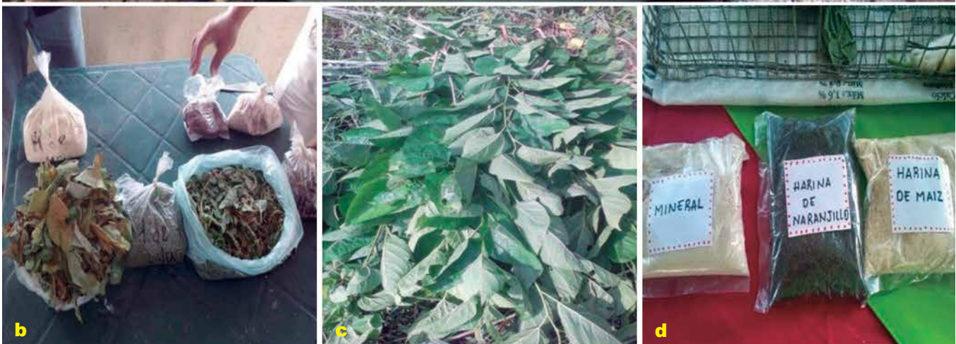
Foto 3 a, b, c y d. Materias primas alternativas utilizadas en la formulación de alimentos para animales: ensilado biológico, hojas deshidratadas de quinchoncho, hojas de morera, hojas de naranjillo y harina de maíz.