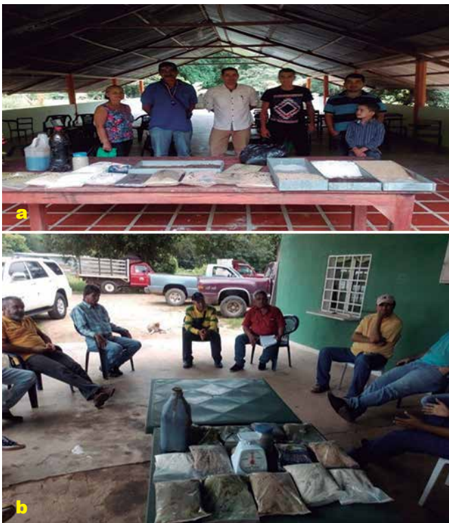
Foto 4 a y b. Intercambio de experiencias y valoración del alimento producido con el uso de materias primas locales.

El uso de equipos artesanales para la producción de alimento y la correcta distribución y sincronización de los procesos, la proyección de la empresa artesanal de producción de alimentos, valoración de la calidad del alimento generado, promoción y divulgación a través de intercambios de experiencias (Foto 4 a y b) dependerá del empoderamiento de la colectividad, permitirá calar un estatus de preferencia en el mercado de productores locales, al manejar adecuadamente los equipos artesanales fabricados, el uso de materias primas de buena calidad y bien procesadas, así como también el resguardo y almacenamiento adecuado del producto obtenido.