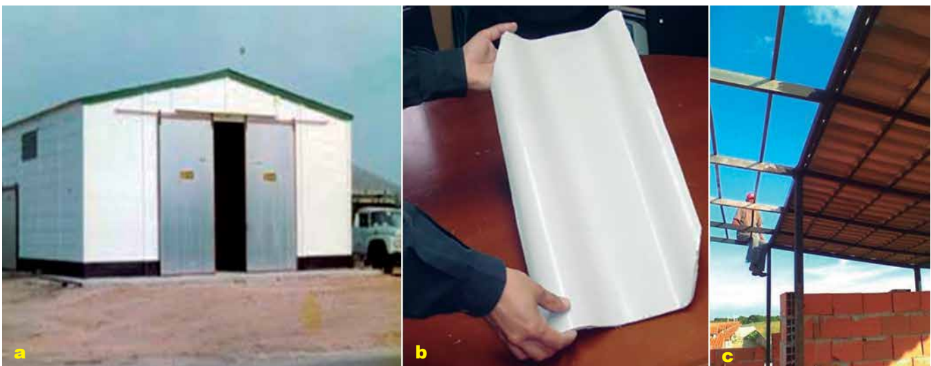
Foto 1 a, b y c. Fachada modelo del galpón, teja y techo de teja ecológica de micro concreto.

La capacidad de oferta de esta empresa está supe- ditada a la demanda, la capacidad de producción y a la disponibilidad de material en el mercado local. Sin embargo, la producción del alimento se generó con el uso de materias primas convencionales y materias primas alternativas con alto potencial en la zona (Foto 3 a, b, c y d).