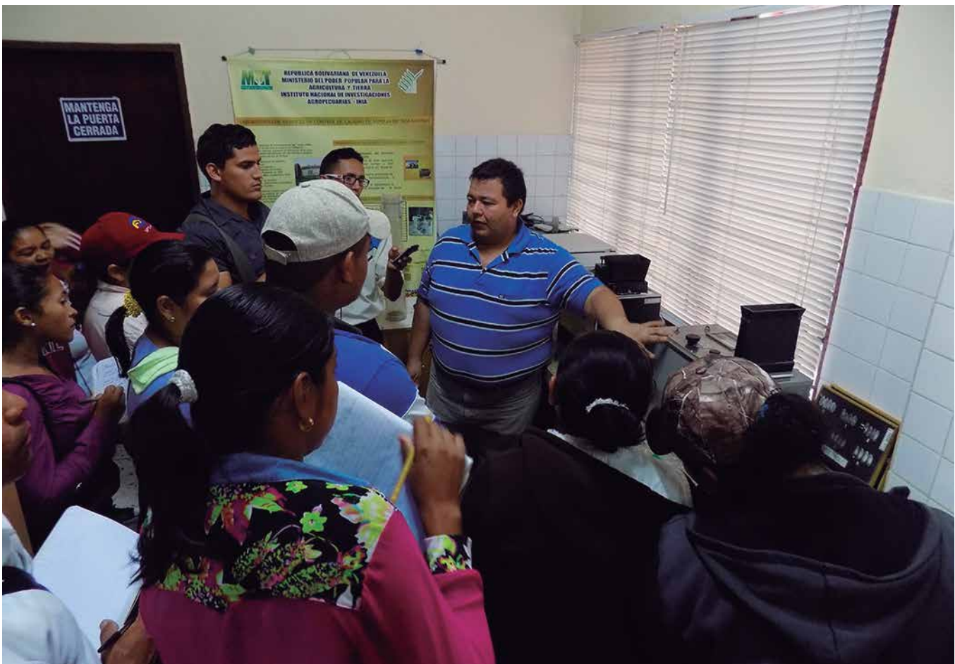
Foto. Charla sobre análisis de calidad de semillas dirigida a productores.