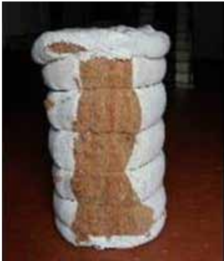
FIGURA 6. Caneta pacote cometidos em fardos de algodão descaroçado após.

O volume do fardo obtido com este equipamento é igual ao das grandes prensas, mas seu peso oscila entre 110 e 120 kg, enquanto nas grandes prensas se obtêm fardos de 190 e 200 kg. Ultimamente, a Empresa Arius desenvolveu um novo protótipo de 20 serras para atender comunidades pequenas de até 10 produtores.