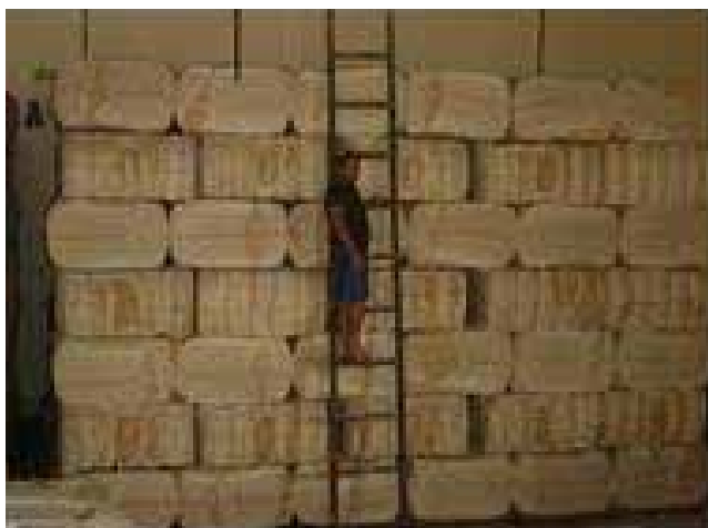
FIGURA 5. Fardos de pluma do algodão BRS 200 Marrom. CAMPAL de Patos, ano 2000.

O beneficiamento foi realizado pela usina da CAMPAL, a Embrapa pagou 15% da pluma de algodão produzida por tais serviços. A outra parte da pluma colorida 85%, pertencente a Embrapa, foi comercializada através da Bolsa de Mercadoria de Campina Grande-PB. Esta fibra foi prensada em fardos de 200 kg (Figura 5).