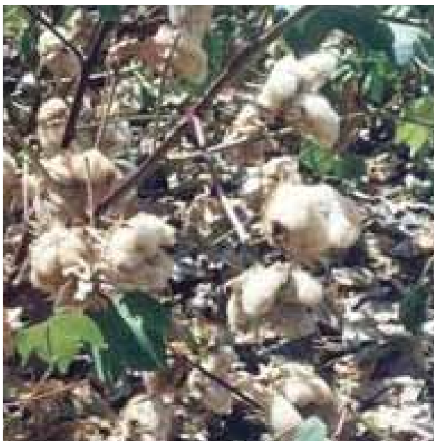
FIGURA 3. Campo de algodão BRS 200 Marrom no ponto de colheita. Itaporanga-PB, ano 2000.

Esta operação foi feita manualmente, em dia de sol, quando pelo menos 60% dos frutos dos frutos estão abertos; uma segunda colheita foi realizada 15 d depois, quando os demais frutos ficaram abertos (Figura 3).