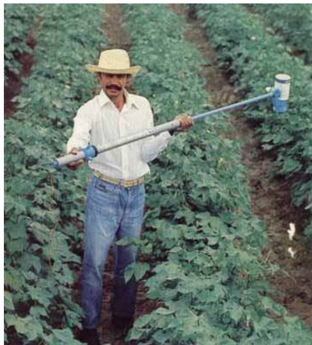
FIGURA 2. Produtor de algodão com o pulverizador Electro-dyn.

Foi recomendado utilizar o pulverizador manual Electro-dyn, apropriado para funcionar apenas com o inseticida Cymbush, que vinha embalado num recipiente com bico de pato, chamado “Bozzle”. Um litro de inseticida “Cymbush” tinha autonomia para 4 ha e custava na época R$ 15 ha -1 (Figura 2).