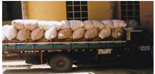
FIGURA 4. Caminhão entregando algodão na usina da Cooperativa Agrícola Mista de Patos Ltda CAMPAL, ano 2000.

O transporte do algodão para a usina de beneficiamento era custeado pela Embrapa SNT. O caminhão carregava entre 10 a 12 t, correspondente a quatro ou cinco produtores. Ao mesmo tempo, registrava-se a procedência e o nome dos proprietários do produto, sob a supervisão de um responsável da Cooperativa Agrícola Mista dos Irrigantes de Catolé do Rocha. Depois que o produto chegava à CAMPAL, novamente era pesado o algodão (o mesmo deveria coincidir com o peso registrado inicialmente), sendo o último peso considerado oficial pela Embrapa SNT para liquidar o produto (Figura 4).