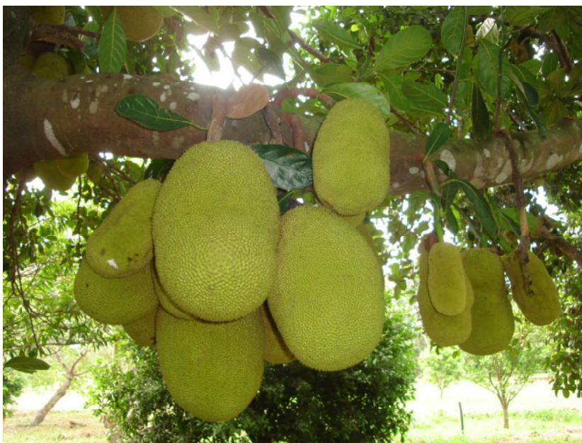
FIGURA 1. Frutos de yaca ( Artocarpus heterophyllus Lam.).

Las semillas miden de 2 a 4 cm de largo y de 1,25 a 2 cm de ancho, de color blanco y sin ondulaciones, encontrándose entre un número de 100 y 500 en un solo fruto (Morton, 1987).