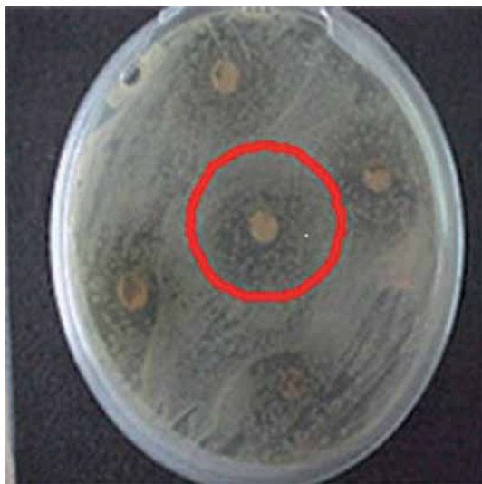
FIGURA 1. Halo de inhibición del extracto de nim sobre la bacteria Erwinia sp. aislada del cultivo de berenjena

determinaron que estos cultivos y las partes de plantas que fueron seleccionadas no tienen actividad biológica para las bacterias del género Erwinia .