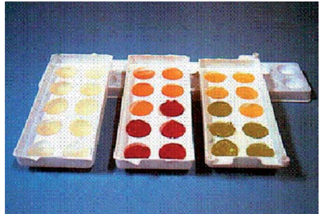
FIGURA 3. Sustratos preparados con agar, para la oviposición de Carmenta foraseminis .

Para la HT se emplearon las jaulas citadas con los sustratos señalados anteriormente, así como también, botellas plásticas transparentes de 1,5; 2 y 5 l de capacidad, forradas con una parte de tela de organdí (Figura 4). A las botellas se les colocaron por separado las bases para la oviposición siguientes: a) toallas de papel humedecido; b) secciones de cartón humedecido; c) segmentos de yute y d) tela de organdí humedecida, junto con fragmentos de mazorcas de cacao, de donde emergieron los insectos. Igualmente, cada botella se introdujo de forma individual en bolsa plástica opaca.