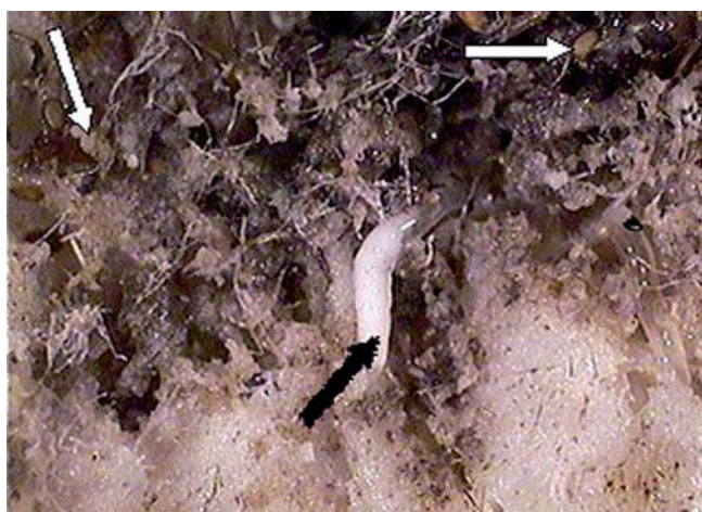
FIGURA 6. Huevos y larva de Carmenta foraseminis .

En contraposición con Delgado (2004) que no logró la emergencia del perforador del fruto de cacao, en el presente trabajo hubo emergencia como se aprecia en la Figura 6.