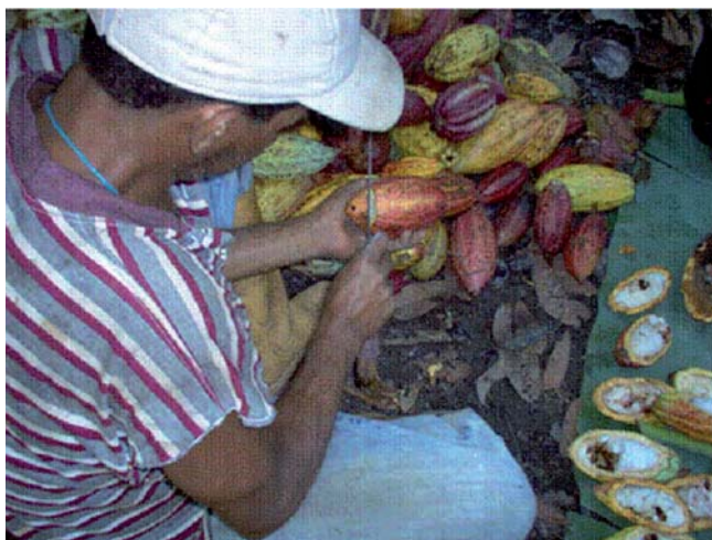
FIGURA 1. Muestreo de frutos dañados por Carmentia foraseminis .

En la HT se efectuaron los muestreos en las pilas de mazorcas de cacao dispuestas para el desgrane. De los frutos dañados por C. foraseminis , se colectaron las larvas y las pupas que se utilizaron en cada uno de los ensayos (Figura 1).