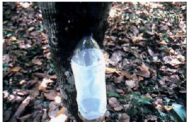
FIGURA 4. Contenedor plástico transparente, forrado con tela de organdí.

En cada receptáculo, tanto para el INIA como para HT, se acomodaron los adultos en diferente número (un macho con una hembra, un macho con dos hembras, dos machos con una hembra, dos machos con dos hembras, dos machos con tres hembras, ocho machos con nueve hembras), según la disponibilidad para el momento de establecer el ensayo. Los huevos obtenidos se trasladaron a cápsulas de Petri, donde se le colocó un papel de filtro humedecido hasta su eclosión.