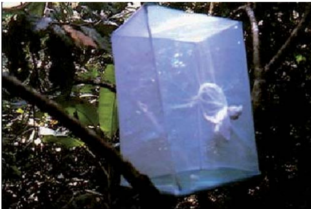
FIGURA 2. Jaulas de cría.

Con el fin de obtener los huevos del PFC en el INIA y en la HT, se emplearon diferentes números de machos y hembras, colocados en recipientes con diversos sustratos para la oviposición. En el INIA se utilizaron los receptáculos siguientes: a) jaulas de 45 x 30 x 50 cm, construidas con una bandeja plástica como base y con una estructura metálica forrada con tela de organdí (Figura 2); b) frascos de vidrio de 0,5 l de capacidad; c) frascos de vidrio de 5 l de capacidad; d) vasos plásticos opacos de 300 ml.