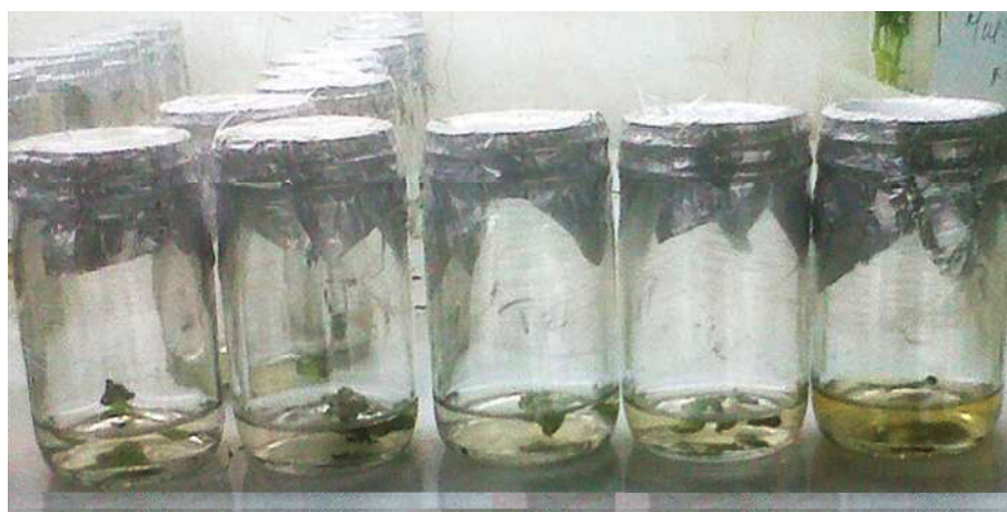
Figura 3. Explantes de Musa AAA cv. Pineo Gigante creciendo en medios de cultivo con diferentes concentraciones de PEG 8000.

Al analizar los cambios observados en la coloración del medio de cultivo, como respuesta al efecto del PEG 8000 sobre el desarrollo in vitro de yemas de cambur ( Musa AAA cv. Pineo Gigante) se evidenció que a medida que aumentó la concentración de PEG en el medio de cultivo, el proceso de oscurecimiento del