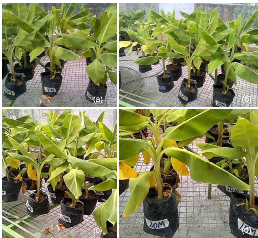
Figura 4. Morfología foliar de plantas de Musa AAA cv. Pineo Gigante regeneradas in vitro a partir de yemas irradiadas. a) plantas con morfología foliar normal. b) hojas lanceoladas, c) hojas elípticas y d) hojas con bordes lisos y bordes ondulados.

El análisis del área foliar se presenta en el Cuadro 6. El análisis de normalidad reveló que los datos se ajustaron a una distribución normal ( W=0,98 ) (Shapiro y Wilk, 1965). De igual modo la prueba de Levene arrojó un valor P=0,19 basado en las medias aritméticas, lo cual demostró la igualdad de las varianzas. La distribución de los residuos siguió una tendencia positiva representada por una línea recta, con igual repartimiento de los