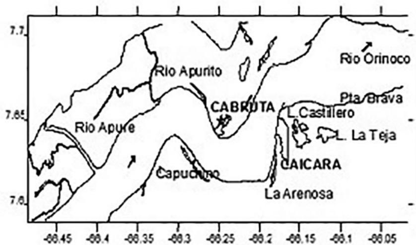
Figura 1. Región Caicara-Cabruta del río Orinoco en Venezuela.

en agua caliente para remover el tejido externo (Penha et al. , 2004a). Los cortes fueron hechos en el extremo inferior de la espina, a una distancia igual a la mitad del ancho de la base, utilizando una sierra metálica de baja revolución y un disco de diamante de tres pulgadas.